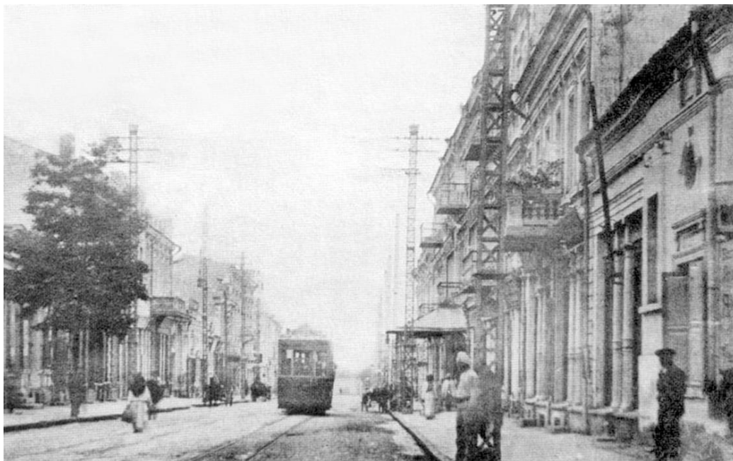
Симферополь. 1922 год

На документе несколько резолюций, которые показывают его путь по кабинетам Наркомпроса РСФСР. 23 марта А. В. Луначарский расписал эту записку на рассмотрение. В резолюции заведующей Главным управлением профессионального образования Народного комиссариата просвещения РСФСР Варвары Николаевны Яковлевой на имя председателя Совета по делам высших учебных заведений Главпрофобра РСФСР Вячеслава Петровича Волгина, датированной 8 апреля, указывается: «Сообщите университету о закрытии агрофака. Укажите, что это постановление коллегии НКПроса. Доведите об этом до сведения т. Фрунзе. Сообщите мне, как обстоит дело с подчеркнутым пунктом 2)». А подчеркнула чиновница пункт об учреждении восточного факультета и выделении на него средств [26, с. 1088].