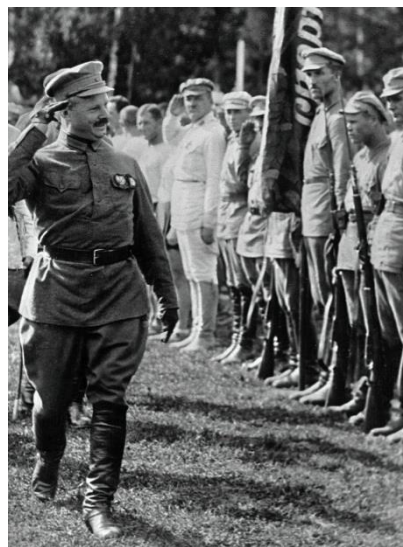
Михаил Васильевич Фрунзе

Россия переживает лихорадочную эпоху самого интенсивного строительства новой жизни. Народившийся социалистический строй планомерно, но быстрым темпом эволюционирует. Ежедневно издается множество декретов, законоположений, распоряжений непрестанно творящих новое право. Но последнее еще не сложилось и для своего претворения в жизнь нуждается в сотрудничестве лиц, обладающих достаточным юридическим образованием. На очереди стоят вопросы кодификации (не только обще-русской, но и местной) отдельных отраслей права, координирования деятельности учреждений, разграничения их