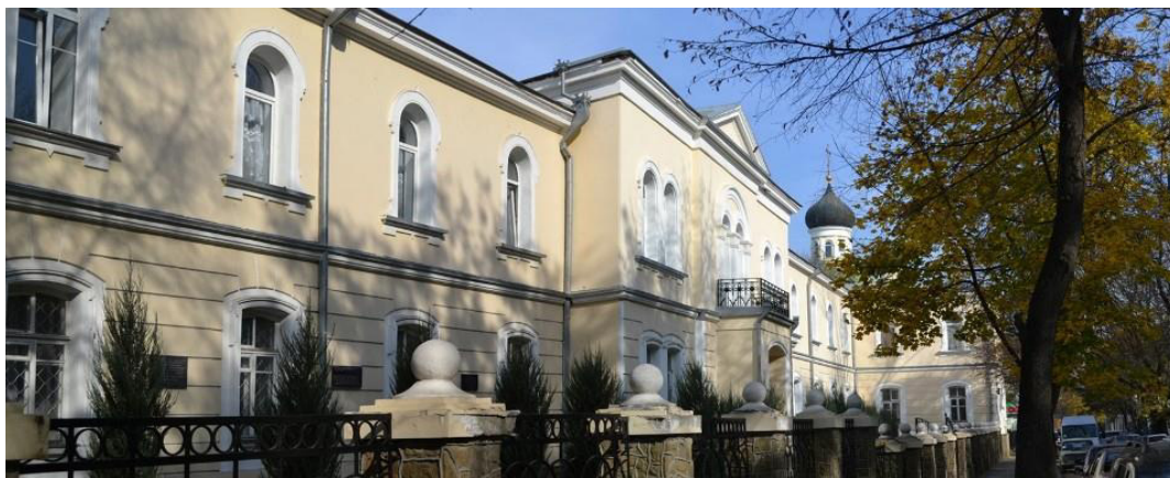
Здание бывшей Таврической духовной семинарии, где располагался восточный факультет. Современный вид