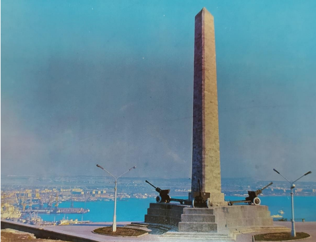
Рис. 6. Обелиск Славы в Керчи.

разработку маршрутов по территории между Белогорском, Старым Крымом и Планерским [31]. В путеводителях, составленных С. М. Щербаком, содержится много сведений о памятных военных объектах Керчи, о работе Аджимушкайской поисковой экспедиции [73; 74]. Ценность справочника «Крым: памятники славы и бессмертия», в состав редакционной коллегии которого входили В. Н. Барбух, Л. Н. Вьюницкая, С. Н. Шаповалова, заключается в том, что в нем собрана информация о создании памятных объектов, их архитекторах и скульпторах [45].