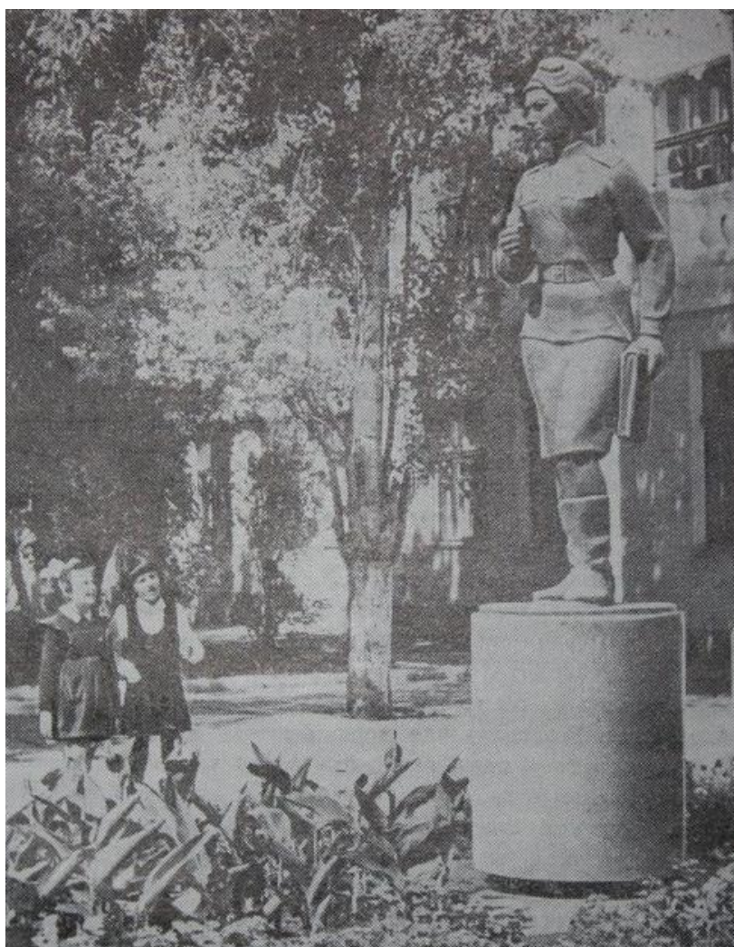
Рис. 7. Памятник Вере Белик в Керчи.

В то же время в деятельности Крымского отделения УООПИКа присутствовали негативные явления, которые стали усиливаться во второй половине 1980-х годов. В этот период сотрудничество Общества и государственных органов власти по сохранению военно-мемориального наследия постепенно уменьшалось. Еще одной тенденцией стало снижение интереса населения к этим вопросам. Многолетняя работа по составлению крымского тома научно-справочного издания «Свода памятников истории и культуры СССР», в подготовке которого принимали участие ученые, краеведы, общественные деятели, была приостановлена.