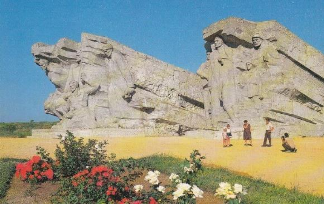
Рис. 4. Мемориальный комплекс «Аджимушкайские каменоломни».

Следопыты Симеизской школы собирали материал о погибших в боях за освобождение Южного берега Крыма, принимали участие в сооружении памятника односельчанам. Ими на старой трассе Ялта – Севастополь обнаружены три братские могилы воинов и партизан [18, л. 2; 38, с. 39]. Ученики встречались с ветеранами, проживавшими в поселке, совместно с педагогами собирали данные в краеведческих музеях и архивах Ялты, Симферополя, Севастополя, отправлялись в походы по местам боевых действий воинских частей и партизанских отрядов, узнавали имена выпускников школы, участвовавших в войне [70, с. 16–17].