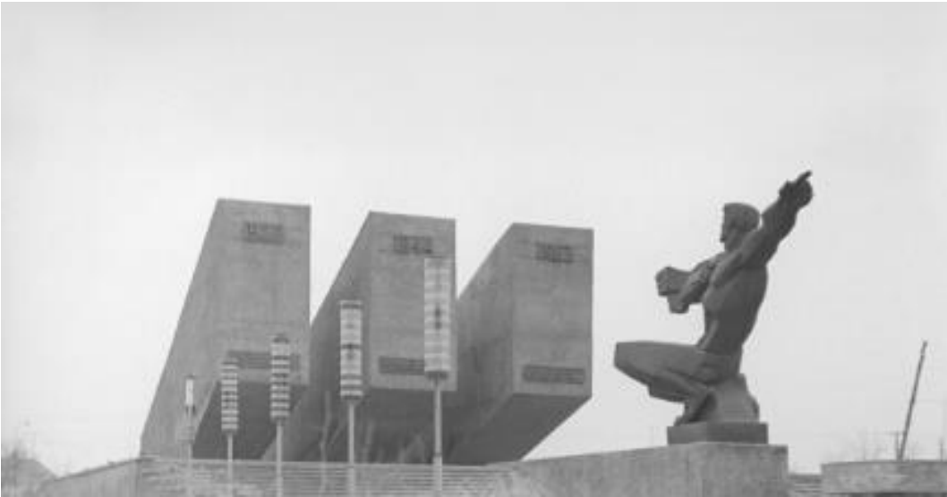
Рис. 3. Памятный знак в честь трех штурмов Перекопа.

Сами школьники принимали участие в поисковом движении «красных следопытов». Они приводили в порядок могилы павших воинов, занимались поиском их родственников, помогали семьям, выступали с инициативой установления памятников и мемориальных досок [60, с. 71–72]. На основе собранных материалов создавались школьные музеи, комнаты, уголки революционной, боевой и трудовой славы. В их экспозициях сосредотачивались ценные документы, освещающие события Великой Отечественной войны, подвиги военных и партизан, боевой путь воинских частей [59, с. 120–121]. На выполнение этой работы Общество выделяло финансирование. Так, Керченская городская организация оказывала материальную помощь на открытие музея Героя Советского Союза, летчицы Е. М. Рудневой (школа № 15), на оформление экспозиций «Закаленная в боях и труде, ты подвигами славишься, Керчь!» (школа № 6), «Короленковцы в боях за Керчь» (школа № 3 им. В. Г. Короленко) [35, с. 26].