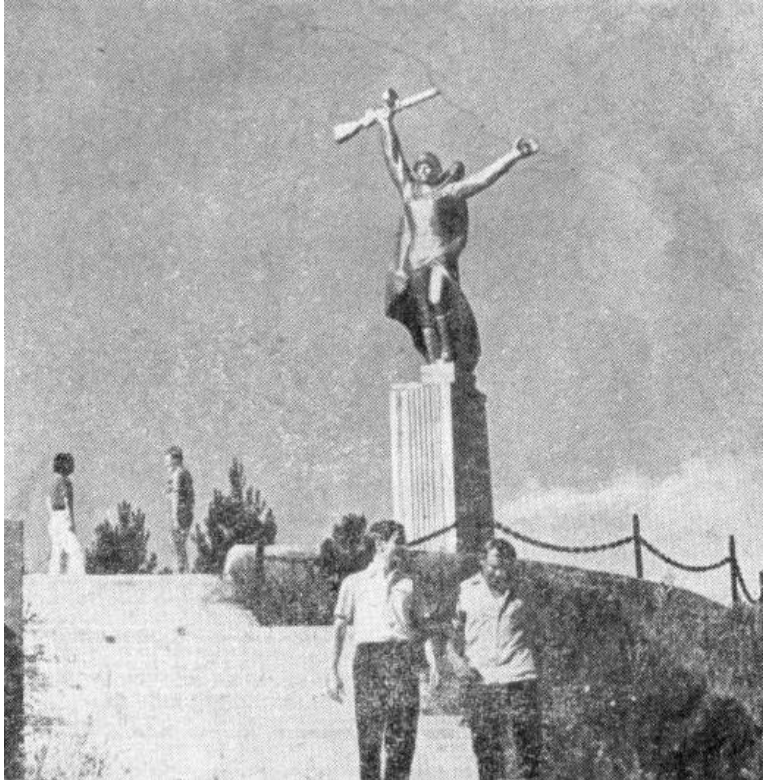
Рис. 2. Памятник в честь соединения войск 4-го Украинского фронта и Отдельной Приморской армии в Белогорске.

В марте 1977 г. водолазы обнаружили в Керченском проливе мотобот, принимавший участие в Керченско-Эльтигенской десантной операции. После поднятия со дна его восстановлением занимался коллектив завода «Залив» им. Б. Е. Бутомы. Спустя несколько месяцев он был установлен в пос. Геройское [3, с. 41–42]. По проекту специалистов Камыш-Бурунский железорудного комбината создавался памятный знак около противотанкового рва на месте боев 386-го батальона морской пехоты [19, с. 16].