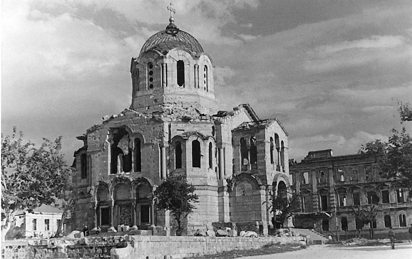
Рис. 6. Владимирский собор в Севастополе. Фото 1945–1946 гг. (по материалам: https://stihi.ru/2019/07/29/4566 ).

памятника исторического. А между тем многие возбуждают вопрос, почему не сохраняется этот памятник – героям известным и неизвестным Обороны Севастополя (1854–55 гг.), являющийся в тоже время образцом строительного и архитектурного искусства. (Рис. 6, 7).