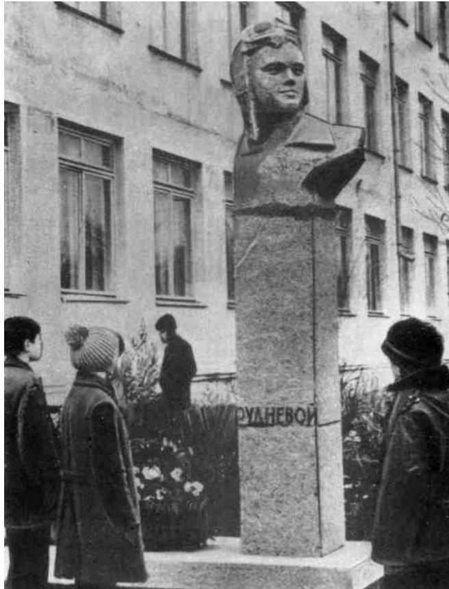
Рис. 5. Памятник Жене Рудневой в Керчи.

Областная организация сотрудничала с Симферопольским государственным университетом им. М. В. Фрунзе (до 1972 г. – Крымский государственный педагогический институт им. М. В. Фрунзе). Еще одной важной инициативой УООПИКа стало создание Народных университетов, первый из которых открылся 1970 г. в Симферополе. К 1985–1986 учебному году в области их количество увеличилось до 14. Учебно-методический план занятий был рассчитан на три года. Подготовка слушателей осуществлялась по специальностям лектор-экскурсовод и общественный инспектор [12, л. 15; 38, с. 37].