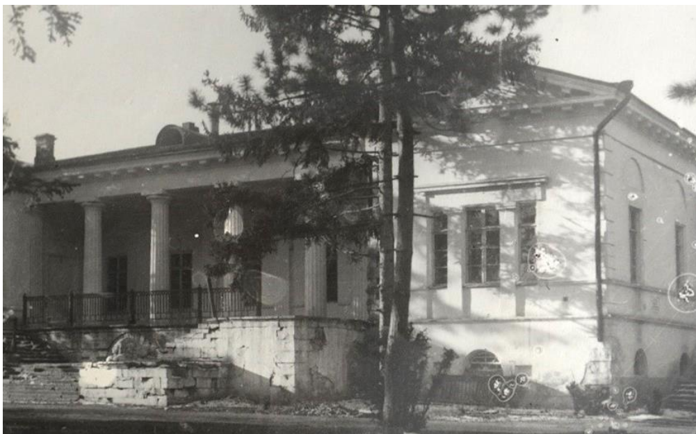
Рис. 1. Бывший путевой дом князя М.С. Воронцова в парке «Салгирка». Фото 1945–1946 гг.