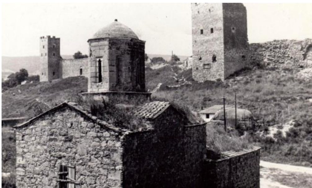
Рис. 3. Вид на Феодосийский карантин. Храм Иоанна Предтечи.

Примеров неблагополучного положения с охраной памятников много. Характерно положение с охраной памятников в Феодосии. Этот город изобилует историко-архитектурными памятниками. Здесь сохранились остатки Генуэзских укреплений XIV века, средневековые сооружения XIII – XIV в., восточные постройки XIV – XVI вв. На памятниках – художественная резьба по камню, резной мрамор, остатки фресок.