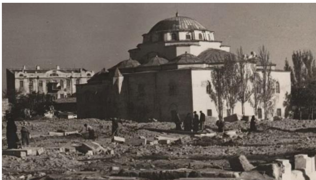
Рис. 4. Евпатория. Вид на мечеть Джума-Джами. Фото 1946–1947 гг.

Городские организации (О[тдел] К[оммунального] Х[озяйства], Гор[одской] исполком, Гл[авный] архитектор), несмотря на неоднократные указания Обл[астного] Отдела Архитектуры не приняли мер по организации охраны памятников своего города. Вызывает тревогу сохранение таких памятников как караимская кенасса, караимские дома, мечеть XVI в., теккие дервишей. (Рис. 4).