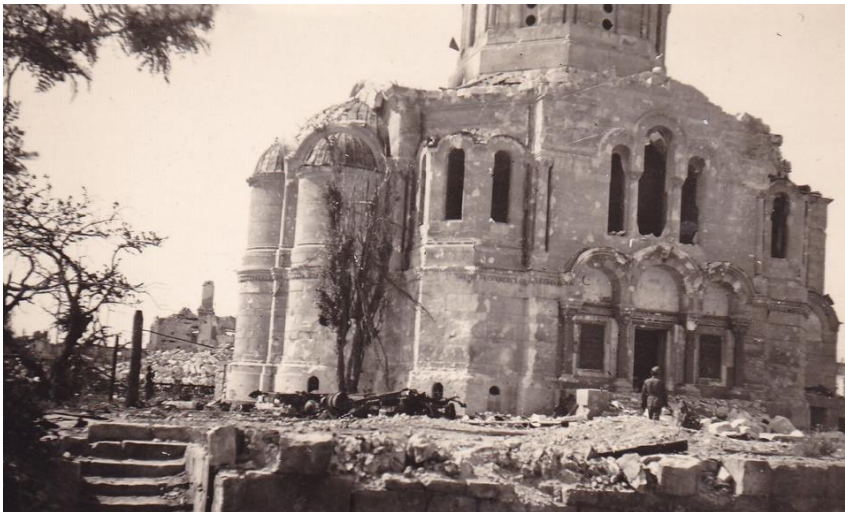
Рис. 7. Владимирский собор в Севастополе. Фото 1942 г..