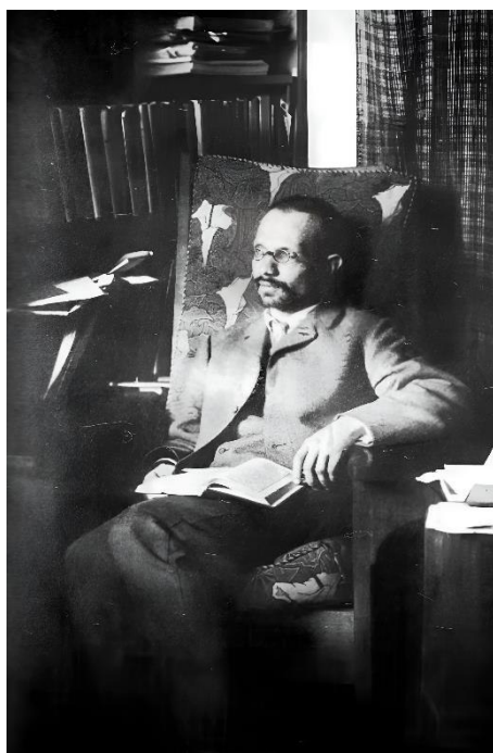
Агафангел Ефимович Крымский. ИРНБУВ, ф. 36, № 744

«формализм музейного типа». Это стало своеобразным прологом к последовавшему в 1929–1931 годы уже окончательному разгрому краеведческого движения, репрессиям по отношению к сотням краеведов и к массовому разрушению памятников архитектуры (в первую очередь – культовых), музейных экспозиций. Звучали и призывы полностью ликвидировать историко-культурное краеведение, как «гробокопательно-архивное». Разгром краеведения был порожден обстоятельствами, характерными для «года великого перелома» (1929 г.), времени наступления на социально-культурные традиции народов. Краеведческое движение не устраивало тоталитарное государство, потому что оно было выражением демократической самостоятельности, роста индивидуального творческого начала, отражающегося на идею преемственности в развитии культуры и общечеловеческих ценностей. Ведь в краеведческой работе, традиции которой восходят еще ко временам земств, приобщение к знаниям, как правило, миновало официальные каналы и обходилось без унифицированных методик и обязательных «руководящих указаний» [2, с. 216–218].