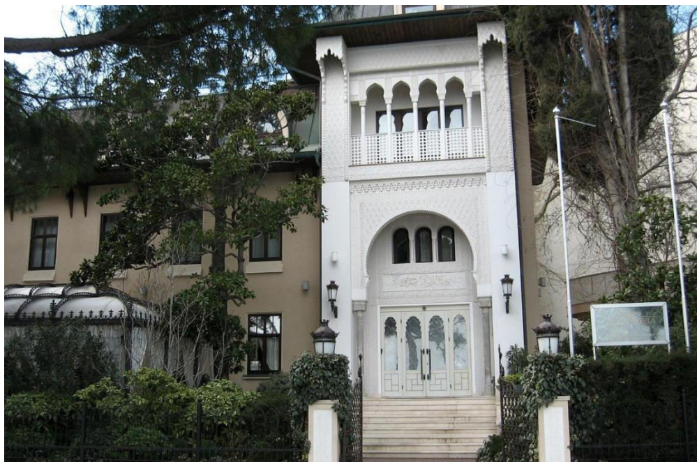
Рис. 5. Парадный портал входа в ванно-лечебное заведение Рофе. Ныне – «Вилла София» (современный вид).

Представители семьи Рофе, как это было общепринято среди российского купечества, активно занимались благотворительностью. Так, например, в 1890 г. Абрам Исаакович Рофе принимал участие в благотворительной лотерее-аллегри, организованной в пользу ялтинской женской прогимназии, а также в лотерее-аллегри, устроенной для Ялтинского благотворительного общества. В 1901 г. он передал 500 руб. на постройку в Ялте пансиона-общежития при Александровской гимназии [54, с. 3; 45, с. 1; 3, с. 1]. А когда в Евпатории было открыто Александровское караимское духовное училище (АКДУ), созданное по проекту известного просветителя и педагога И. И. Казаса, от ялтинских караимов на нужды АКДУ поступило пожертвований на сумму 1223 руб., причем из них 600 руб. передали купцы А. Рофе и Е. Майтоп [6, л. 252; 8, л. 29].