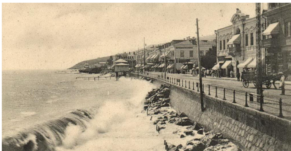
Рис. 1. Набережная Ялты (с дореволюционной открытки)