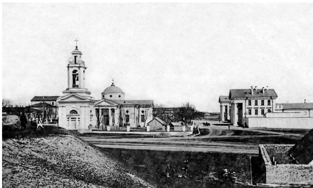
Рис. 6. Екатерининский собор в Херсоне. Фото начала XX в.

князем Потемкиным, английским министром и министром императора. Как только она поднялась со своего места, музыка прекратилась и к 8 часам бал окончился; херсонские дамы отправились танцевать в другое место» [3, с. 181–182].