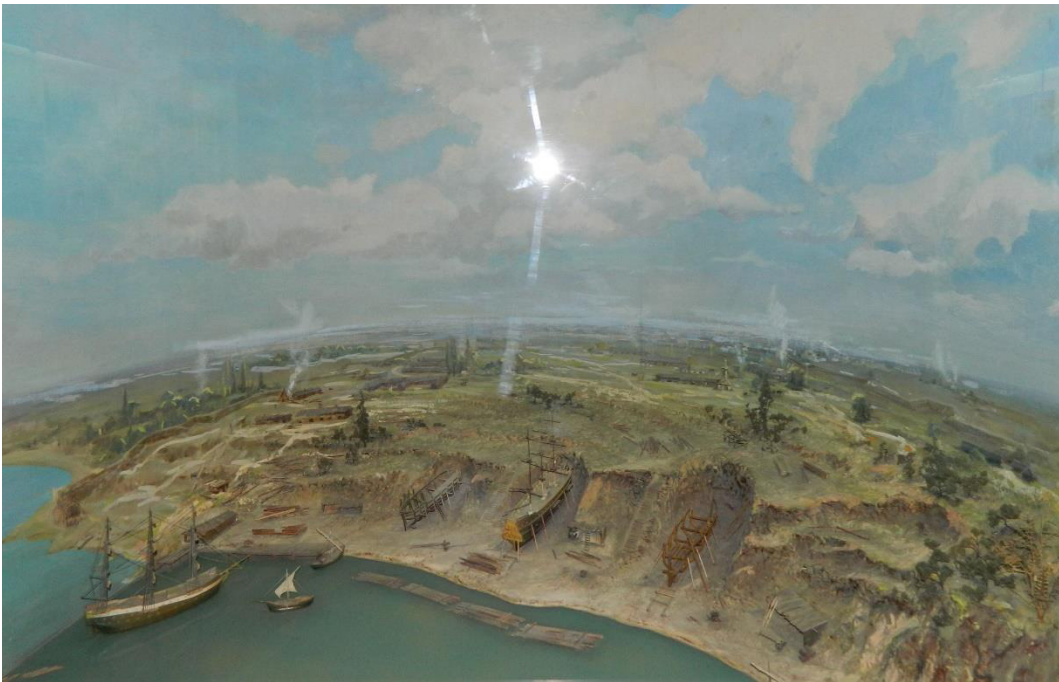
Рис. 3. Херсонская верфь (1780-1790-е гг.). Диорама Херсонского краеведческого музея.

существовало восемь лет назад. Сначала мы приехали в каменные казармы шести полков; потом повернули направо, въехали в крепость, которая состоит в отделке, совсем поспеет в нынешнее лето, и несравненно лучше Киево-Печерской. Внутри крепости военные строения, многие окончены, некоторые приводятся в отделку. Церковь каменная прекрасная. Когда я говорю каменная, не подумайте, чтобы под сим разумелся кирпич. Здесь иного камня не знают, как тот, который, вынув из земли, кладут в стену. Он крепче плиты и сырости не принимает. Выехав из крепости, повернули мы в адмиралтейство, в котором все магазины строения каменного, покрыты железом. На стапелях нашли мы готовый 80-ти-пушечный корабль, который в субботу, Бог даст здоровье, спустим на воду. Возле сего 60-ти-пушечный готовый; возле сего фрегат 55-типушечный. Сии корабли, из моего дома, и из той комнаты, в которой к вам пишу, видны, и сад сего дома возле адмиралтейства и стапели. Купеческого города, который с другой стороны составляет предместье, я еще не видала, но сказывают, не хуже. Народа здесь, кроме военных, великое множество, и разноязычные с большей части Европы. Я могу сказать, что мои намерения в сем краю приведены до такой степени, что нельзя оных оставить без достодожной похвалы. Усердное попечение везде видно, и люди к тому избранны способные» [1, с. 320–321].