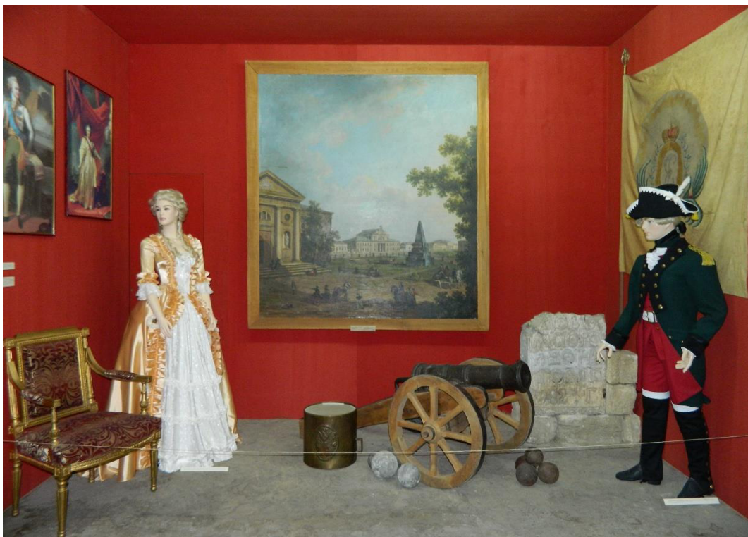
Рис. 4. Екатерина II в Херсоне. Экспозиция Херсонского краеведческого музея.

15 мая (26 мая по н.с.) стал самым знаковым и торжественным за все время пребывания императрицы в Херсоне. «Журнал» очень сухо сообщает общую канву этого субботнего дня: в присутствии Екатерины II и графа Фалкенштейна на воду были спущены два 80-пушечный и 66-пушечных линейных корабля «Иосиф II» и «Владимир» и 50-пушечный фрегат «Александр» (рис. 3).