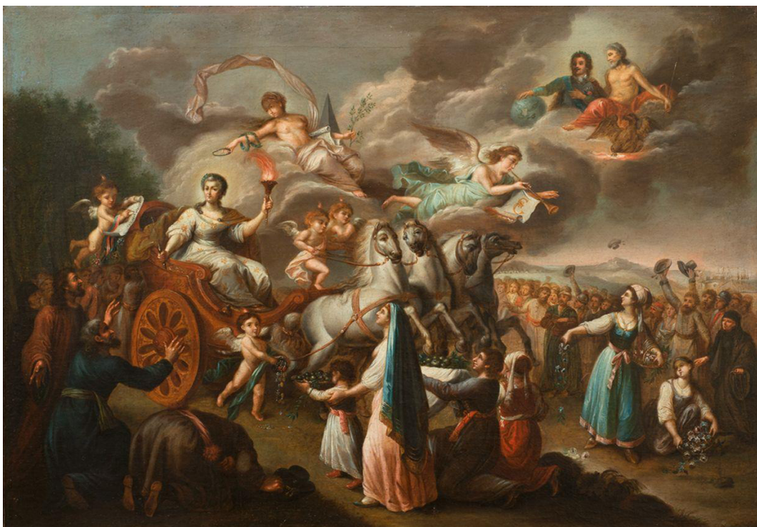
Рис. 1. Картина Фердинанда Мейса «Путешествие Екатерины II по России». 1790-е гг. Коллекция ФГБУК «Государственный Русский музей» (г. Санкт-Петербург).