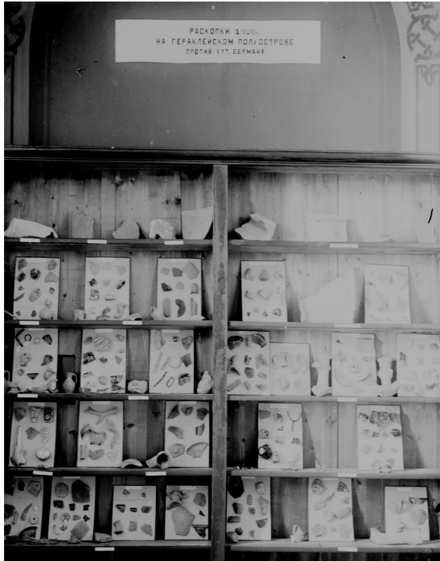
Рис. 1. Вещи из раскопок на Гераклее у хутора Бермана. Выставка во Владимирском соборе. 1928 г.

разворачивались отдельные эпизоды сражений. Подводные археологические находки этого периода, сохранившие массу интересной и уникальной информации, достаточно скудно представлены в музейных экспозициях. Потенциал данной темы для исследователей истории Херсонеса обозначен выше названной выставкой. Отдельно следует добавить, что каждый эпизод в выставочном пространстве имел свое цветовое решение.