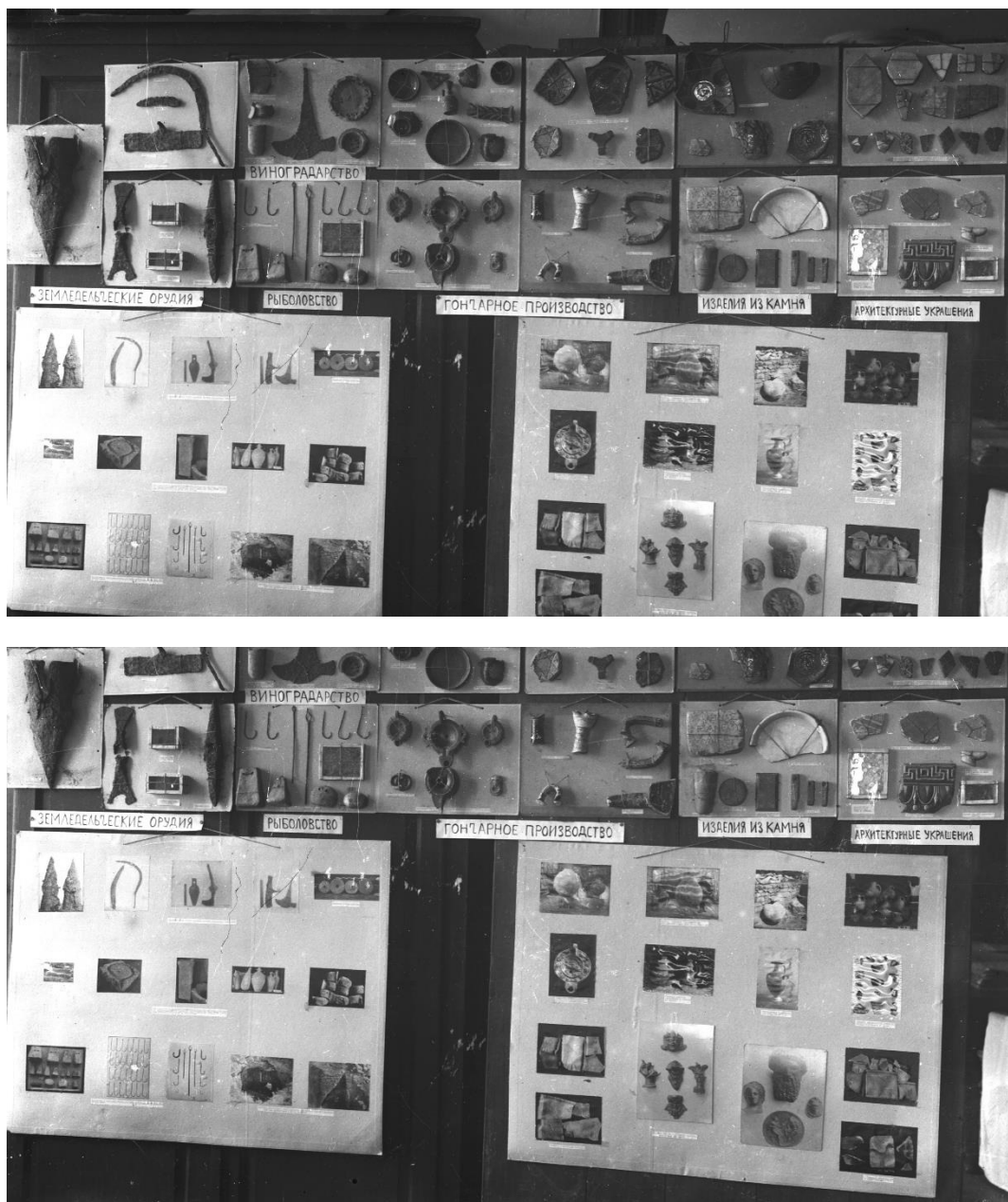
Рис. 5-6. Выставка-передвижка Государственного Херсонесского музея. Разделы: античный Херсонес – история и основы экономики (рыболовство, земледелие, виноградарство, строительное дело, гончарное производство). 1930 г.