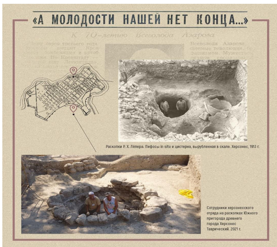
Рис. 14. Планишет стендовой выставки «Взгляд из раскопа».

«Повседневная жизнь» (макеты стола и стула, краснолаковая посуда, лепной светильник, амфоры);