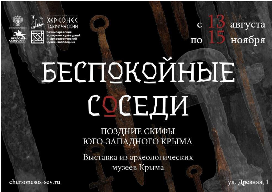
Рис. 12. Афиша выставки «Беспокойные соседи: Поздние скифы юго-западного Крыма».

Выставка 2020 года «Девять жизней в Херсонесе» также была посвящена изображениям представителей семейства кошачьих на археологических предметах (куратор – П. Н. Хлебовский). Изображения грациозных хищников в архитектурном декоре, на столовой посуде, светильниках и других бытовых предметах были излюбленным мотивом античных и средневековых мастеров. Наиболее полно была представлена посуда, единичными экземплярами были ручка саркофага в виде львиной морды с кольцом в зубах, костяная рукоять мужской бритвы в виде грифона и фаянсовая подвеска-амулет в виде лежащего льва. Иллюстративным дополнением были современные фотографии котов Херсонесского музея.