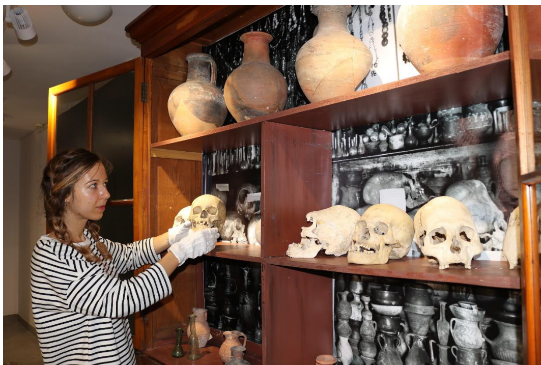
Рис. 8. Выставка «Тайны Херсонесских некрополей». Монтаж экспозиции.