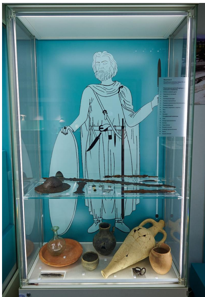
Рис. 13. Выставка «Мир варваров Таврии. Херсонес, Рим, Византия». Фрагмент экспозиции.

«Сельская усадьба как производственный центр» (демонстрация находок – зёрен и плодов культурных растений, изображений сельскохозяйственных работ на античных мозаиках, 3D-реконструкция усадьбы 338);