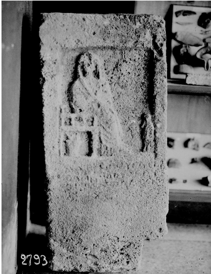
Рис. 2. Выставка во Владимирском соборе в 1928 г. из раскопок в цитадели. Надгробие первых веков н.э. Известняк. Барельеф – сидящая в кресле женская фигура в плаще, рядом слуга. Под изображением надпись.

Для полноты картины назовем еще одну публикацию, посвященную очередному выставочному проекту в Херсонесском музее, – «Роль К. К. Косцюшко-Валюжинича в формировании научной библиотеки Государственного музея-заповедника «Херсонес Таврический» [37]. Авторы статьи Т. А. Прохорова и Н. В. Рубаненко через призму рассказа о временной выставке представили в сжатой форме историю формирования научной библиотеки музея и отметили выдающую роль в этом деле первого заведующего раскопками Карла Казимировича Косцюшко-Валюжинича (1847–1907). Авторы статьи пришли к выводу, что музейная библиотека сформировалась в значительной степени на основе личной книжной коллекции К. К. Косцюшко-Валюжинича, и поэтому может рассматриваться как уникальное собрание книг, сформировавшееся при жизни археолога.