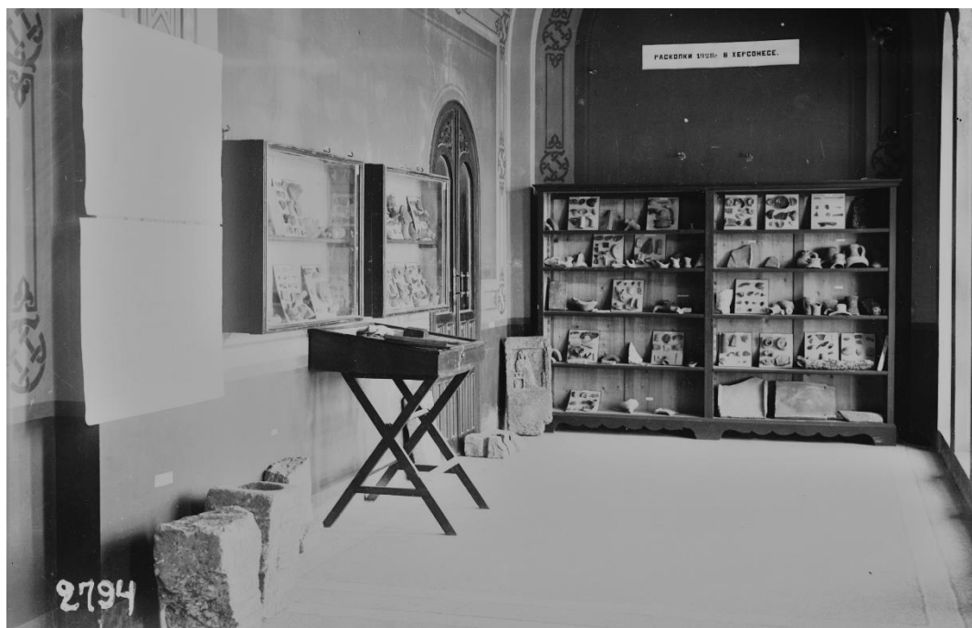
Рис. 3. Отчетная выставка раскопок 1928 г. в Херсонесе (в цитадели). Общий вид. Выставка в соборе.

Анализ библиографии демонстрирует актуальность данного направления исследований, учитывая высокий интерес коллег к опыту археологических выставок со стороны различных представителей историко-археологического профессионального сообщества. Отдельная секция, посвященная проблемам археологических выставок и исследования архивных материалов, была выделена в ходе проведения круглого стола «Вокруг Боспора», проходившая 15–16 февраля 2022 г. в Государственном Эрмитаже [20].