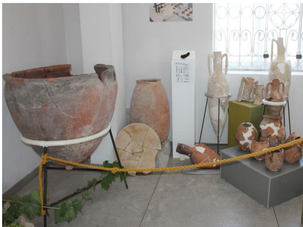
Рис. 11. Выставка «Сельские этюды». Фрагмент экспозиции..

изображениями: носики чернолаковых сосудов в виде львиной головы, фрагмент ручки в виде головы пантеры, терракотовая подставка в виде львиной (грифоньей) лапы, пиксиды (?) в виде грифона, фрагменты металлической посуды, пряжки, дверные ручки, архитектурные детали, а также необычные предметы, не связанные с конкретным стилем в искусстве, – например, средневековая плинфа с отпечатком кошачьих лап. Представление экспонатов на едином терракотовом фоне позволило добиться целостности и гармоничности восприятия на этой достаточно пестрой и по цвету, и по разнообразию предметов выставке. В дальнейшем именно благодаря правильно подобранному цветовому решению на выставках удавалось создать цельную, простую и глубоко продуманную композицию. Использование единого или контрастного фона, выделение тематических частей цветом, «игра» с освещением, использование разных пропорций фона и фактур, яркости и интенсивности фона. Определенная цветовая гамма способна менять ощущение от самого археологического материала, выделить его или подчеркнуть, усилить впечатление от экспозиции.