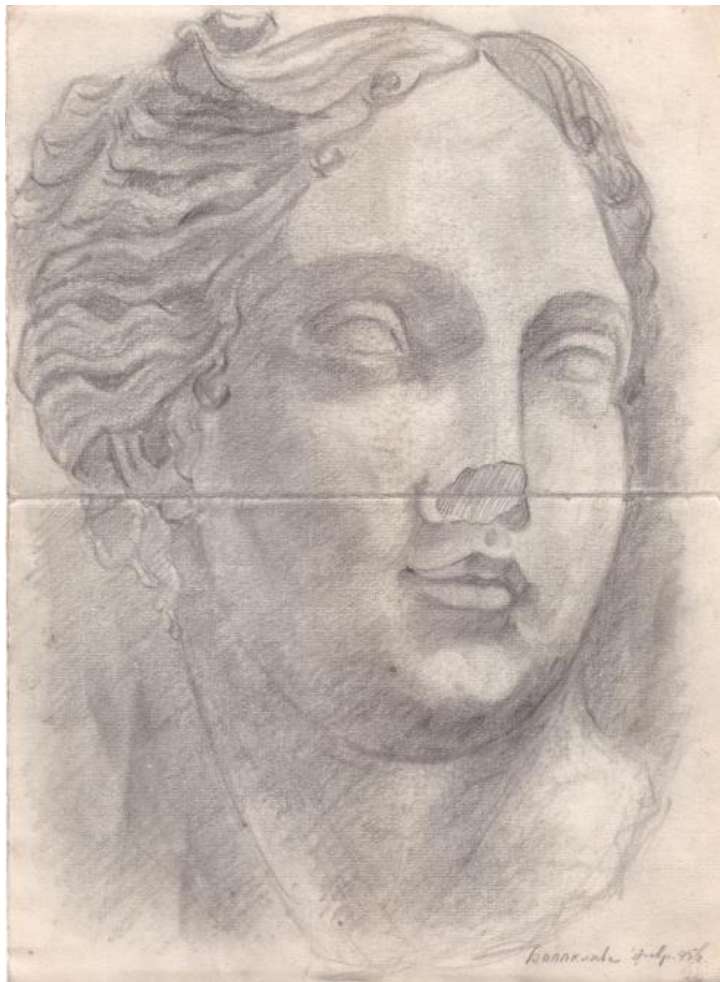
Рис.1. Голова Венеры. Балаклава, 1945 г.