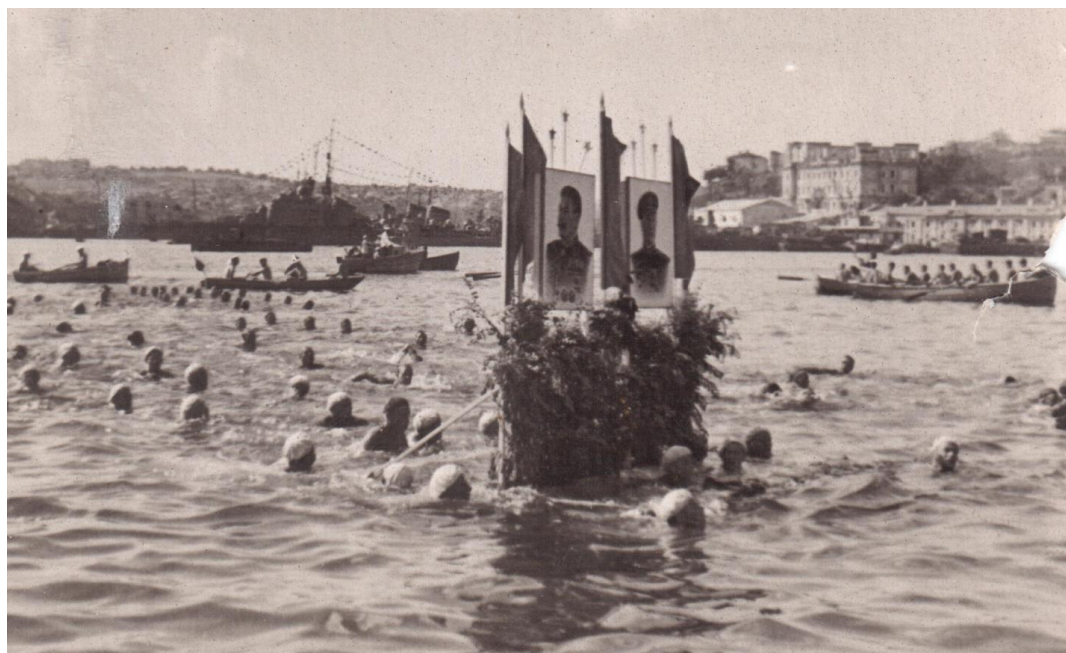
Праздник в Севастополе (?) Крым, 1945–46 гг.

считать пьянство, дебоширство, агрессивное поведение, череду самоубийств и вообще «глупых» смертей после войны. В послевоенном дневнике Георгия Ивановича немало свидетельств проявления посттравматического синдрома и его следствий в среде матросов Черноморского флота. Приведем здесь всего одну запись: «В это время на кораблях началось вообще что-то страшное. Не проходило ночи, чтоб на лодки не притаскивали целые кучи мертвецки пьяных матросов и, что еще хуже, избитых до потери сознания. Однажды ночью на «Львов» принесли троих матросов. На каждом из них было до десятка ножевых ран (...) Целые дни мы обычно болтались в море (к счастью) с утра до вечера. После пьяных бессонных ночей все выглядит бледно. Головы сами собой клонились на маховики и штурвалы приборов. Бесчисленные тревоги выматывали остатки сил. Но лишь только по радио получали сигнал конца учений и на горизонте всплывала узкая полоса Колхиды, усталости как не бывало. Все начинали деятельно готовиться к предстоящему бедламу. Очевидно, это дух недалекой демобилизации действовал так разлагающе. Иначе что?» Рисунок к этой записи сохранился (рис. 5) [13, с. 111]. Отметим здесь, что большинство записей, связанных с неуставными отношениями, алкоголем, агрессией и общением с женщинами «легкого поведения», относятся к пребыванию лодки в порту города Поти, а не Балаклавы или Севастополя [12, с. 2039].