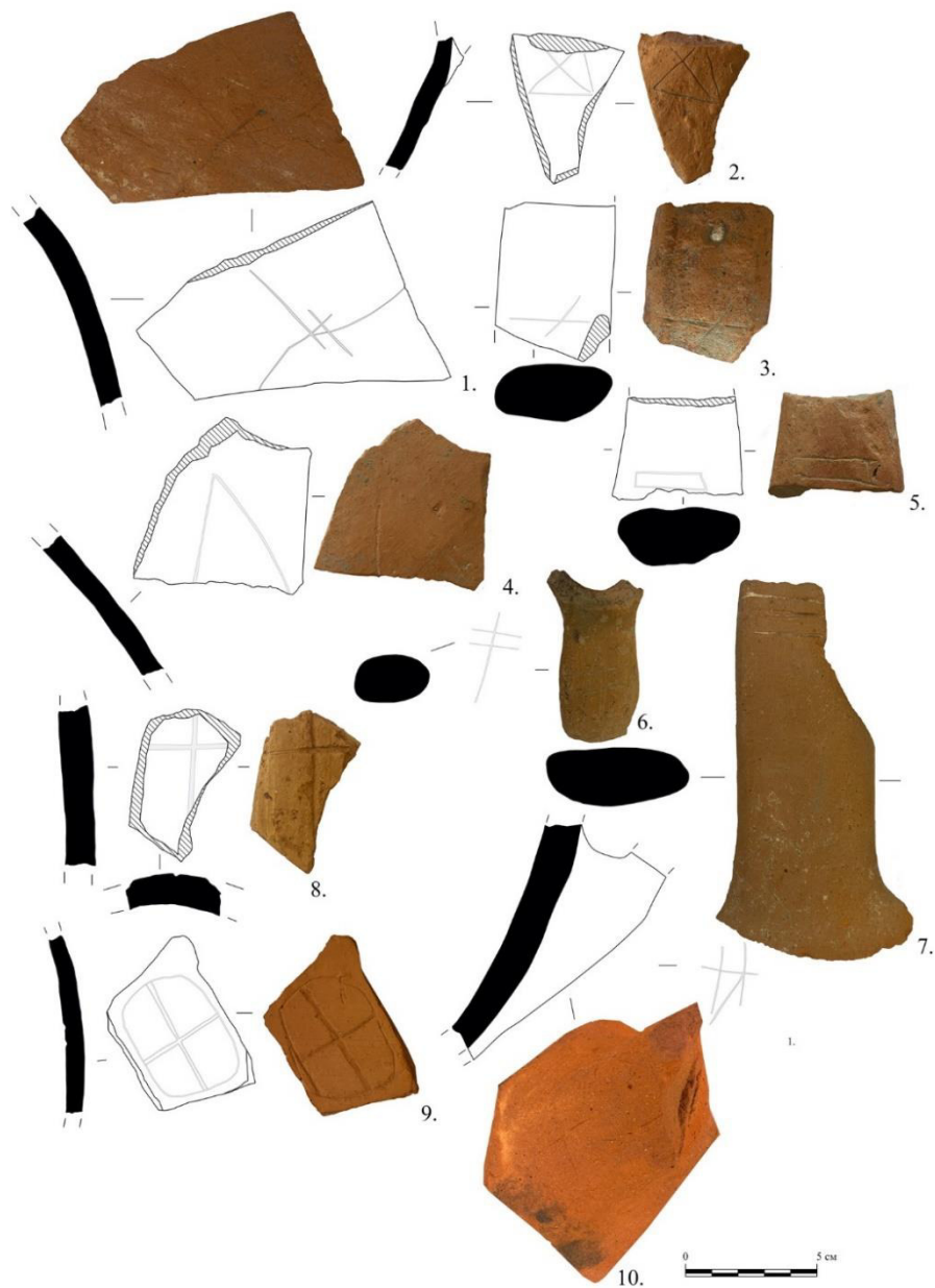
Рис. 1. Фрагменты керамических сосудов с граффити из раскопок городища Солхат в 2020–2021 гг.

элемент обрядности был заимствован из Византии, где, в свою очередь, он и фиксируется, начиная с X в. [16]