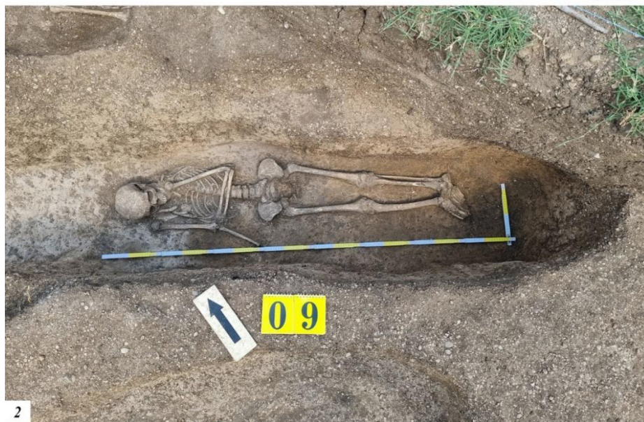
Рис. 2. Погребение № 9. 1 – Чертеж. Общий план и разрезы. 2 – Фотография. Общий план.