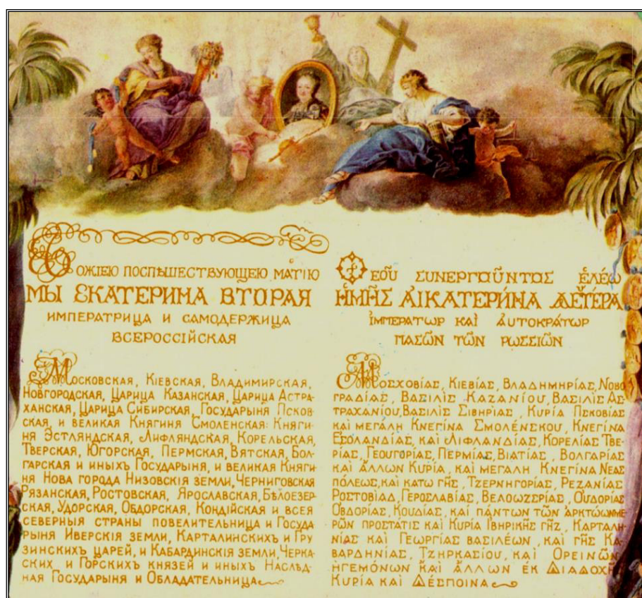
Рис. 1. Жалованная грамота императрицы Екатерины II приазовским грекам (фрагмент первой страницы)

За тридцать лет, прошедших после поселения греков, они не смогли заселить все столь щедро дарованные им Екатериной II земли, часть их сдавалась в аренду или использовалась греками, оставаясь пустошью, под пастбища для овец. На это обратил внимание таганрогский градоначальник барон Б. Б. Кампенгаузен, предложив 7 марта 1808 г. министру внутренних дел империи изъять незаселенные и пустующие земли мариупольских греков. Министр счел предложение разумным, и только указ Александра I (9 июня 1808 г.) отсрочил решение вопроса об изъятии на три года, дав грекам возможность заселить и освоить их остававшиеся пустующими земли [7, с. 106–108]. Понятно, что за это ограниченное время количество греческих селений существенно увеличиться никак не могло, но весной 1811 г. греки, например, основали с. Новый Керменчик (сейчас – с. Новомлиновка Розовского района Запорожской области) [18, с. 44].