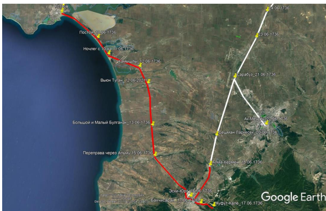
Рис. 3. Дорога Гезлев–Бахчисарай