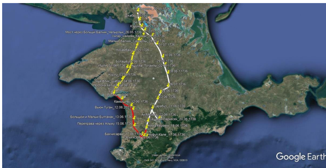
Рис. 1. Схема маршрута фельдмаршала Миниха в Крыму в 1736 г. (желтым цветом отмечена дорога Перекоп–Гезлев; красным – Гезлев–Бахчисарай; белым – обратный путь из Бахчисарая в Перекоп);

Коджалак – с. Красноармейское Раздольненского района Бутаиш – ныне с. Чапаево Первомайского района Соганлы – с. Кормовое Первомайского района Яйшилы – в 0,5 км от с. Тихоновка Первомайского района Шанике – с. Куликово (несущ.), в 0,5 км к З от с. Кормовое Первомайского района. Бузьяйши – локализация неизвестна Чифтлик Ибрахима-эфенди – локализация неизвестна (возможно, Шибан (Шабань) (с. Победное Сакского района) [11, с. 46–48].