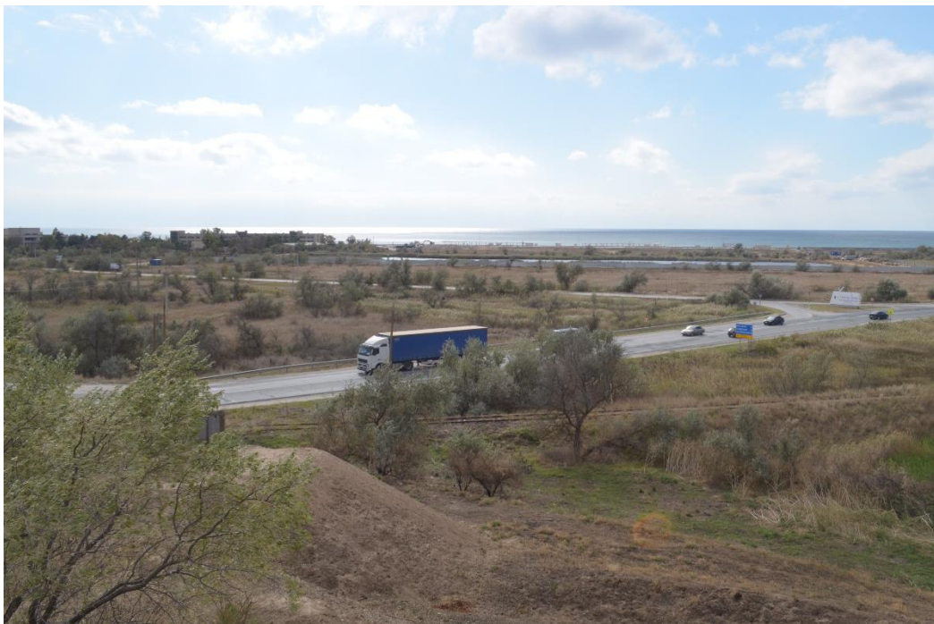
Рис. 5. Вид на северную часть Сакской пересыти, которую российская армия преодолела 10 июня 1736 г.

Далее из Алма-Кермена, расположенного в долине реки Альмы, армия Миниха выступает в долину реки Западный Булганак. Трасса Перекопского тракта пересекла долину этой реки в районе современных сел Пожарское и Демьяновка Симферопольского района. Вполне возможно, что на постой войска расположились поблизости тракта – в районе села Сеймонларкой. В настоящее время в этом месте в долине р. Западный Булганак находится искусственная запруда.