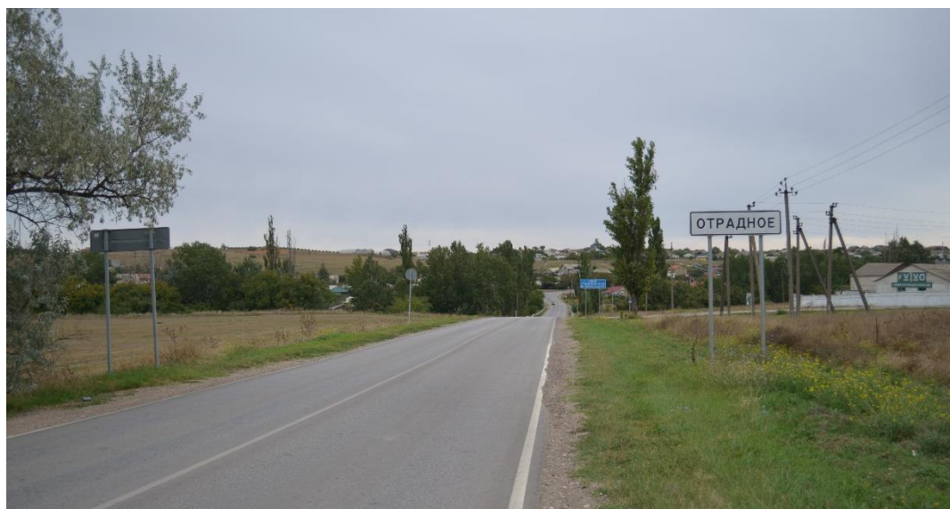
Рис. 7. Предполагаемое место переправы армии фельдмаршала Миниха через реку Альма 15 июня 1736 г. в районе с. Отрадное Бахчисарайского района.