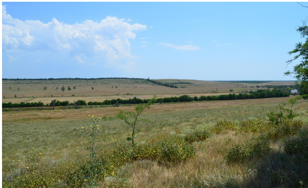
Рис. 6. Предполагаемое место постоя российской армии 13–14 июня 1736 г. в долине реки Западный Булганак в районе с. Равнополье Симферопольского района.