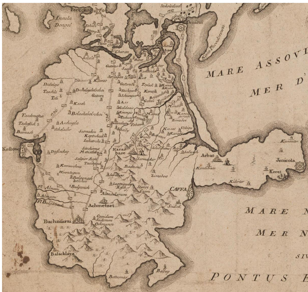
Рис. 4. Карта «Подлинная Таврика Херсонесская или Крым» Карла Фридриха фон Фрауендорфа (переиздание в пределах середины XVIII в.) с указанием маршрута Х. А. Миниха в Крым в 1736 г.

Отметим, что второй этап пути армия Миниха преодолела всего за неделю, несмотря на постои в Джавджуреке и непрерывающиеся нападения крымской конницы. Значительная часть маршрута тракта Гезлев – Бахчисарай продолжает использоваться до настоящего времени, в частности – на участках Евпатория – с. Прибрежное (рис. 5), с. Ивановка – трасса Симферополь–Николаевка, с. Отрадное – г. Бахчисарай. Участок от Сакского озера до Ханышкоя имел альтернативные параллельные пути: