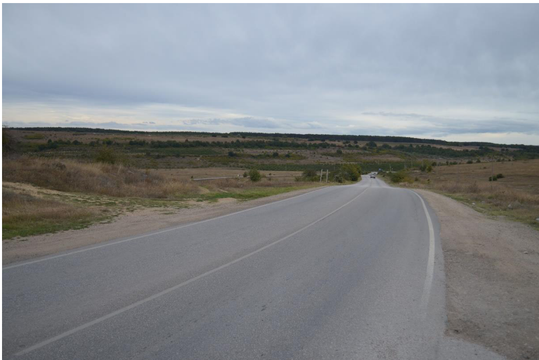
Рис. 8. Предполагаемое место расположения обоза российской армии в районе с. Викторовка Бахчисарайского района.

Отметим, что сил для взятия мощных укреплений Кефе у Х. А. Миниха было недостаточно, однако ложная угроза достигла своего эффекта. «И понеже армия марши свой от 18 числа от Бахчисарая продолжила держа к Кафе, оставляя Перекопскую дорогу налево [отойдя к Салгиру, тракт Бахчисарай – Перекоп действительно оказался на левом фланге армии Миниха – В. Р.], то неприятель мыслил, якобы мы к Кафе маршируем, чего для все лежащие по тому тракту деревни разорял, и все что в них было, выбрал, а лежащие на левой стороне оставлял все в целости, в которых мы зело немалое число для пропитания регулярного и нерегулярного войска получили провианта и фуража» [3, с. 77]. Ложные слухи привели к максимальному разрушительному эффекту – часть своих деревень противник уничтожил самостоятельно, реализовывая тактику выжженной земли на предполагаемом маршруте российской армии. При этом по пути вдоль Салгира и в дальнейшем по тракту Карасубазар–Перекоп подразделения фельдмаршала Миниха забирали продовольствие и сжигали все окрестные деревни. Вполне возможно, что уничтоженные деревни впоследствии не возродились либо возродились с другими именами – по крайней мере, пока только так в настоящее время мы можем объяснить невозможность интерпретации крымских хоронимов по возвращению армии Миниха на Перекоп. При этом данные по ежедневным