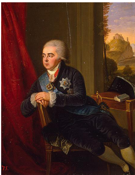
Алексей Борисович Куракин. Художник Людвиг Гуттенбрунн.

Екатерина II во время своего путешествия в Крым писала Я. А. Брюсу «Херсон почитать можно между самыми лучшими городами нашими. Сие дитя много обещает, где сажают, тут все растет, где пашут, тут изобилие, строение все каменное, мы жары по сю пору не чувствуем, все здоровы, здешние люди большого вида не имеют и все копышется, людство великое и стечение людей со всех краев, наипаче же все полуденные» [7, с. 114]. Еще более высоко оценивались перспективы экономического развития Тавриды. Данный тезис прослеживается в письмах Екатерины II, Г. А. Потемкина, высших сановников, а также в первых научных описаниях Крыма.