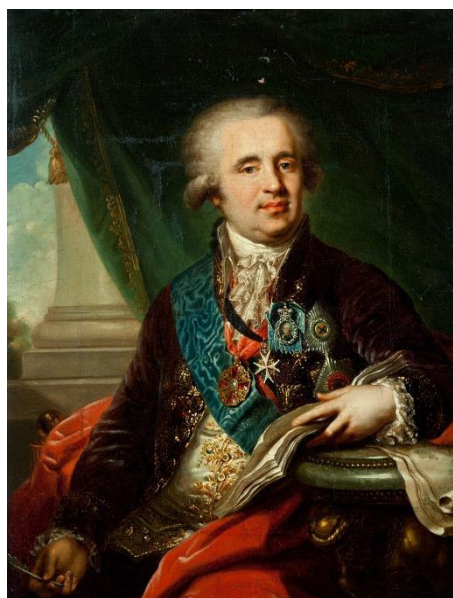
Александр Андреевич Безбородко. Художник И. Б. Лампи.

возглавлял новообразованное присутственное место консул. Кроме того, по штату полагалось два переводчика, три писца и четверо рассыльщиков. Всего на содержание Таврического консулата жаловалось 2950 руб. в год [18, л. 8]. Оклад консула составлял 800 руб. в год и в несколько раз превышал жалованье инспекторов таможенной стражи крымских портов, получавших 300 руб. Таким образом, составители подчеркивали начальственное положение консула. Определяемые переводчики должны были знать армянский, греческий, итальянский и турецкий языки: «поелику одного с такими знаниями найти весьма трудно, каждому из них определить по 300 руб. Оные также могут у консула исправлять и должность секретарскую, каждый по своей части» [18, л. 3–5]. Примерно такие же оклады были у переводчиков в годы существования