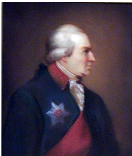
Петр Александрович Соимонов. Портрет неизвестного художника.

во всех обстоятельствах, по мере оных важности, быть подчиненным его наставлениям или разрешениям» [18, л. 3–5]. Также консул должен был выявлять среди прибывающих и убывающих иностранцев шпионов. В случае обнаружения подозрительных лиц он был обязан доложить военному губернатору. Ему же он подчинялся по всем делам «касающимся земского управления». Таким образом после учреждения нового органа управления в гражданской части на полуострове возникла коллизия, так как полномочия между консулом и уездными присутственными местами никак не разграничивались.