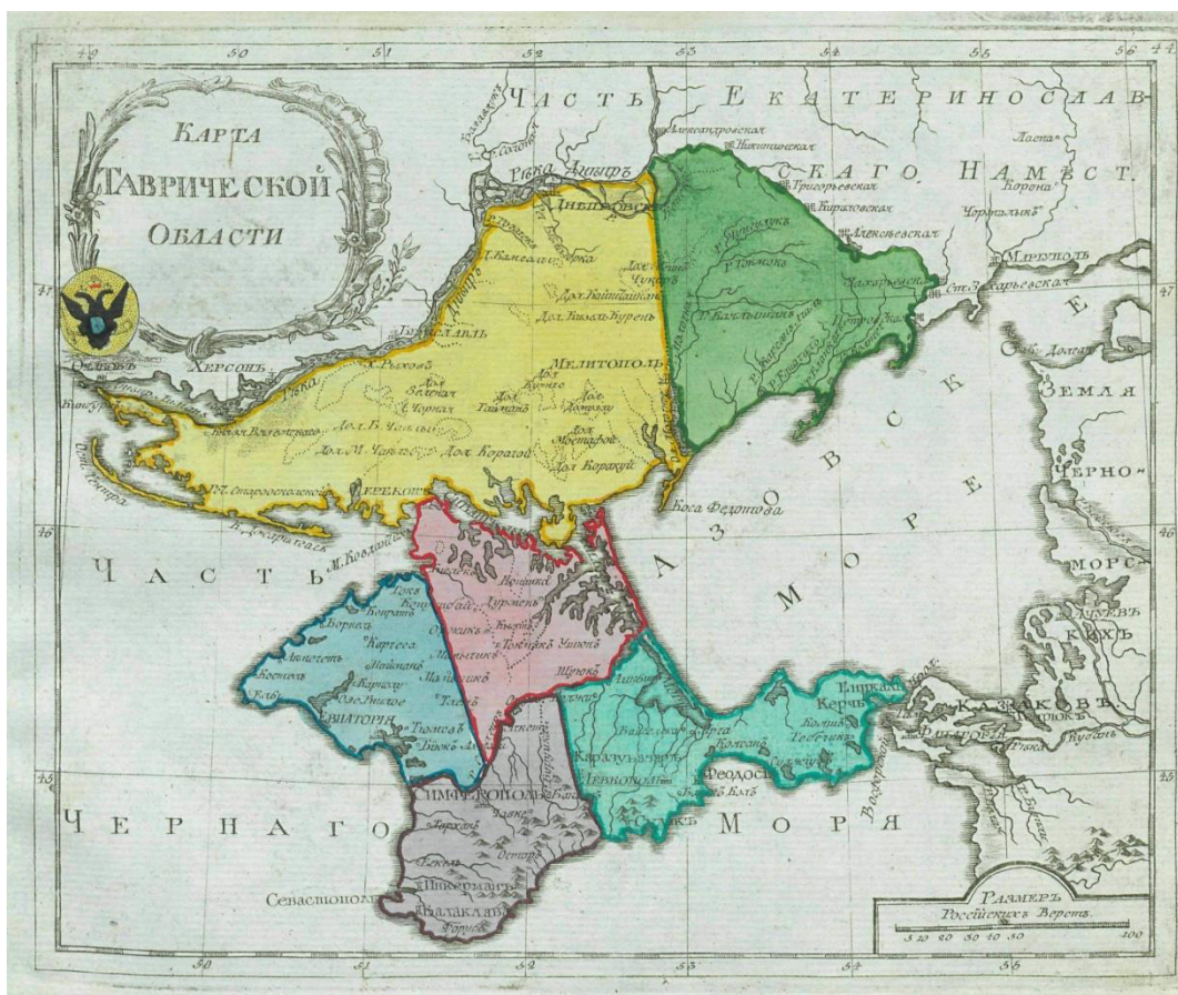
Карта Таврической области. Малоформатный атлас Российской империи (1792 г.)

упоминание развитой торговли в периоды античности и средневековья. Многие авторы игнорировали очевидные сложности: нашествия саранчи, чередование периодов засухи и холодных зим, неразвитость логистики и внутренней торговли. Часто забывали упоминать об изолированности черноморских портов, когда любой конфликт с Османской империей вел к прекращению связи со Средиземным морем. При этом представители интеллектуальной элиты Российской империи не видели источником роста местное население. Большинство считало, что полуостров нужно заселить славянами и иностранными колонистами, сделать христиан доминирующей частью населения. Такое восприятие реальности делало освоение полуострова крайне затратным мероприятием и увеличивало вероятность растянуть этот процесс на долгое время.