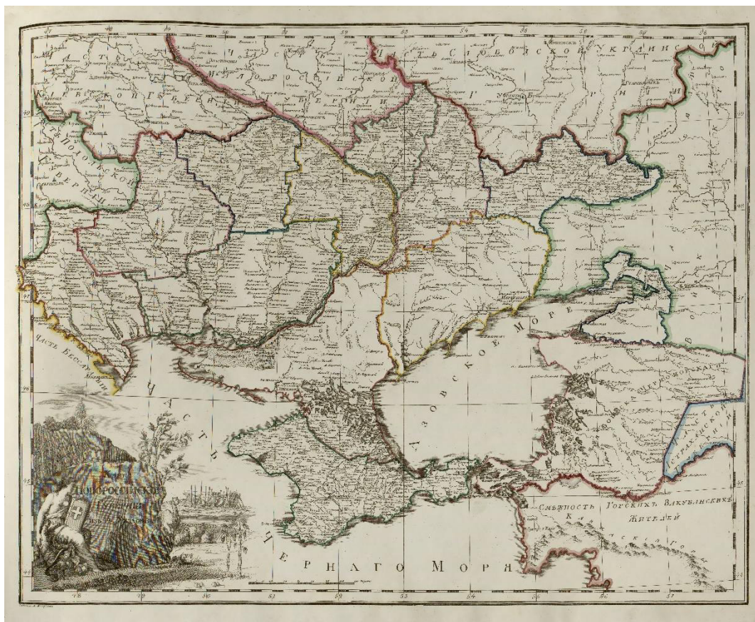
Карта Новороссийской губернии. Атлас Российской империи (1800 г.).

Новороссийская губерния, в которой были объединены Екатеринославское и Вознесенское наместничества и Таврическая область [15, с. 229–230]. В Тавриде реальная ликвидация сложившегося при Екатерине II административного устройства происходила уже в 1797 г. Местным чиновникам давалось определенное время на завершение дел и передачу их в новые присутственные места. На территории Таврической области создавалось два уезда – Акмечетский и Перекопский. К началу лета основные преобразования были завершены. В это же время регион должен был покинуть бывший правитель области генерал-майор Семен Семенович Жегулин. Высшим должностным лицом, оставшимся на полуострове, был командующий войсками в Крыму генерал от инфантерии Михаил Васильевич Каховский. Именно ему пришлось столкнуться с одним из важнейших последствий реформы 1796 г.