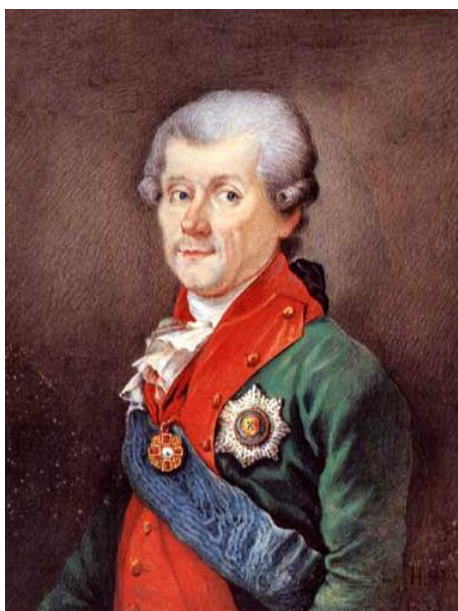
Михаил Васильевич Каховский. Портрет неизвестного художника.

Таврической области, а затем и Таврической губернии [3, л. 2–4; 5, л. 68–69]. Писцам и рассыльщикам полагалось по 150 руб., служащие данных категорий в штатных органах управления относились к канцелярским служителям и их оклады определялись в зависимости от суммы, выделявшейся каждому конкретному органу управления на канцелярские расходы. Для данной категории чиновников установленный оклад был достаточно высоким [8, с. 32–33].