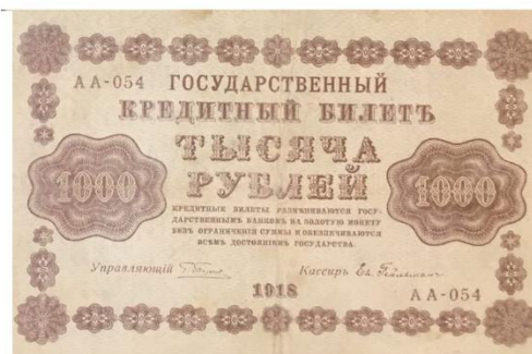
100, 250, 500 и 1000 рублей образца 1918 года.