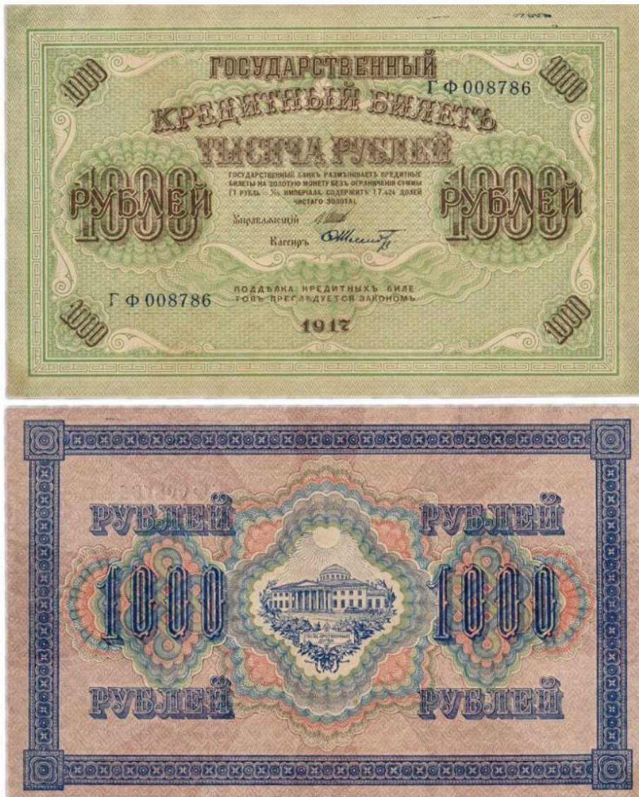
1000 рублей 1917 года.