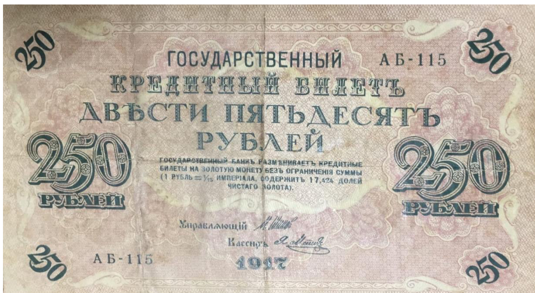
250 рублей образца 1917 года.

Первые общероссийские деньги уже с по-настоящему советской символикой появились в 1919–1920 года. На одном из образцов в фондах Музея истории денег есть автограф народного комиссара финансов РСФСР Николая Николаевича