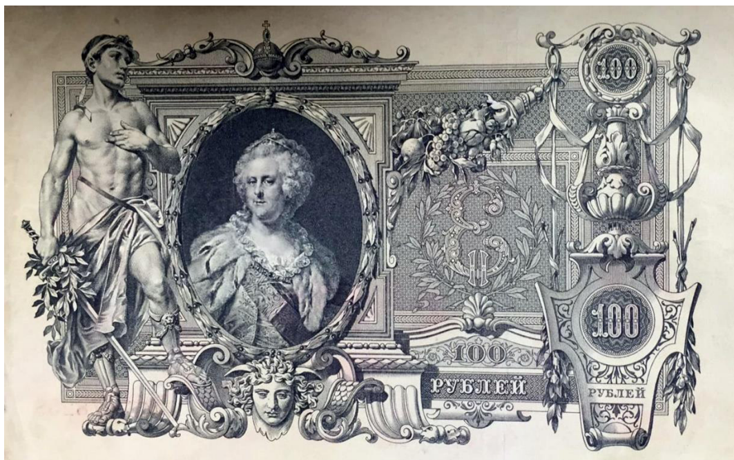
100 рублей образца 1910 года. «Катенька».

миллионов рублей. В начале 1922 года счет денег пошел уже на миллионы и миллиарды. Количество ничем не обеспеченных денег было огромным [26, с. 1].