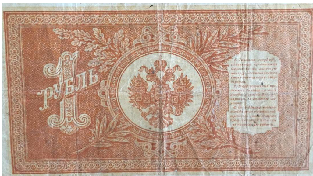
1 рубль образца 1898 года.