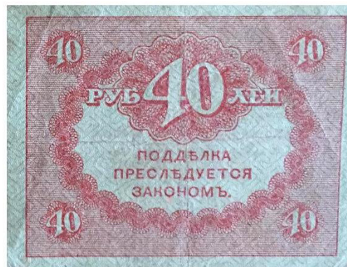
20 и 40 рублей образца 1917 года. «Керенки».

В начале 20-х годов XX века галопировала инфляция. Выпускались все новые и новые серии совзнаков. Самый крупный номинал был в 100 тысяч рублей. Однако выпускались еще и платежные обязательства РСФСР достоинством до 10