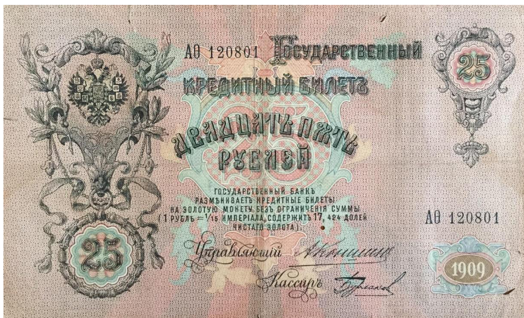
25 рублей образца 1909 года.