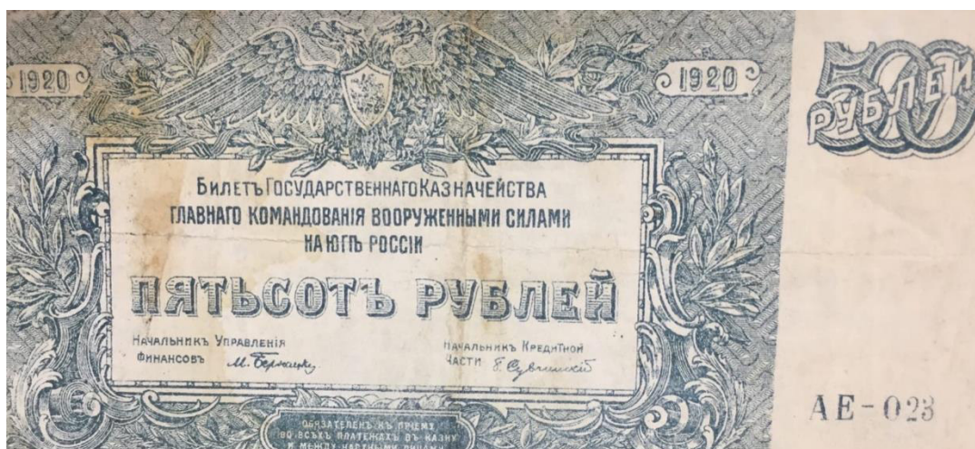
500 рублей образца 1920 года.

В 1921 году была провозглашена Новая экономическая политика. Поэтому в том же году начинается разработка будущей денежной реформы, которая должна была, наконец, стабилизировать денежное обращение в Советском государстве. Реформа проходила в несколько этапов. Вначале в оборот были запущены червонцы.