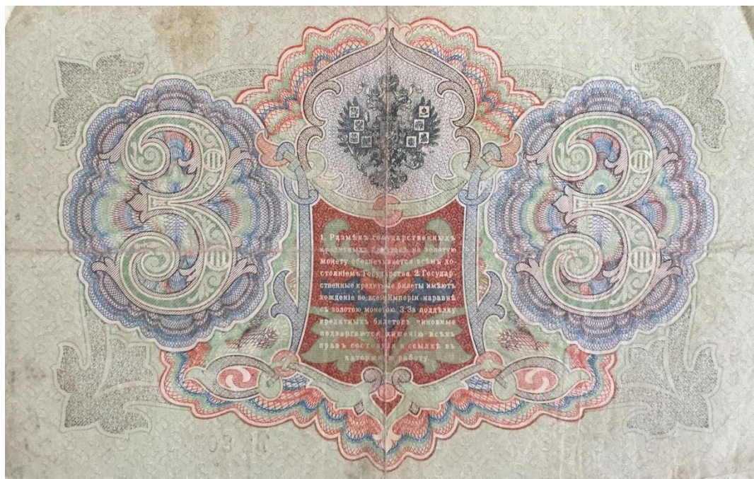
3 рубля образца 1905 года.