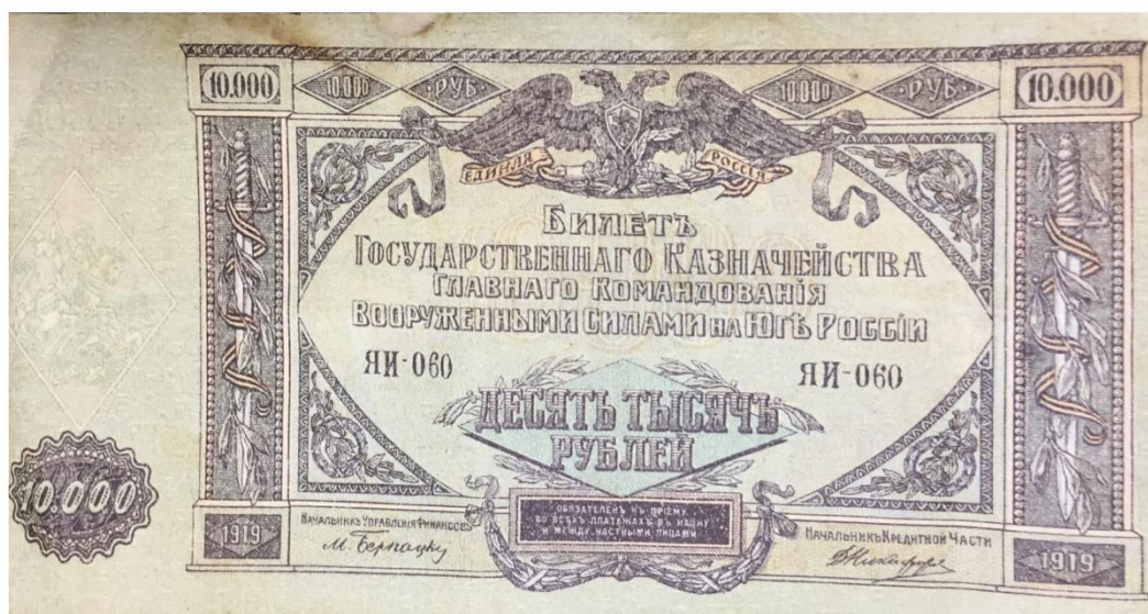
10 000 рублей образца 1919 года.

червонцы, которые были, хотя и не полностью (на 25%), обеспечены золотом. Можно сказать, что именно червонец стал своего рода локомотивом, который вытащил финансовую систему страны из глубочайшего кризиса. В нем она находилась еще со времен Первой мировой войны. Это стало результатом решения о проведении экономической реформы. Она вошла в историю под названием «реформа Сокольников». Червонец вошел в оборот в конце 1922 года. Боны были односторонними и довольно просто оформленными. Но по размеру они были достаточно большими. Что ограничивало их использование для разовых расчетов [22, с. 40]. Создается впечатление, что им стремились скорее придать форму документа, нежели банкноты. Однако очень важной является надпись: «Один червонец содержит 1 золотник 78,24 долей чистого золота». В соответствии с современной метрической системой – 7,78 грамма золота. То есть это уже была не просто бумага в виде денег, а вполне полновесная купюра, которая была обеспечена драгметаллом. Но существовал один нюанс. Их невозможно было в банке обменять на золотую монету, как когда-то было возможно обменять царские деньги – так называемые «катеньки» и «петеньки». Появление червонца в виде банкноты предопределило появление червонца в виде чеканных монет. Они полностью соответствовали еще не забытому царскому червонцу, запущенному еще в свое время С. Ю. Витте. Совзнаки по курсу 100 000 : 1 менялись на новые. Это соотношение как нельзя лучше характеризовало масштаб бедствия в финансах страны.