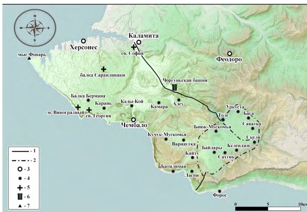
Рис. 2. Карта консульства Чембальского во второй половине XIV в.

Храм на г. Мачук (Св. Георгия) XV – конец XVII вв. Храм расположен на склоне г. Мачук к северо-востоку от перевала. В 1976 г. церковь и часть окружающего её некрополя исследована Е. А. Паршиной. Он представлял собой однефную прямоугольную в плане постройку с полукруглой апсидой. Внутренние размеры храма: длина 6,3 м, ширина у западной торцовой стены 3 м, диаметр апсиды 2,06 м. Его стены с внешней стороны сложены из плоских известняковых плит относительно правильной формы на известковом растворе, внутренний панцирь стен сооружен преимущественно из рваного крупного бута. Пол храма выложен сланцевыми плитами. Левое «плечо» храма имеет ширину 0,6 м, справа же апсида переходит непосредственно в стену, что можно отнести на счет позднейших перестроек, превративших первичный трехапсидный храм в одноапсидный. Эта постройка была покрыта полукруглой черепицей-татаркой. Внутри храма в завале камня найдены архитектурные детали: известняковая капитель, камень с монограммой, обломок плиты с орнаментом «плетенкой», части мраморной колонки и предалтарной преграды. Под плитами пола оказались 26 серебряных монет Крымского ханства XV–XVI вв. и бронзовая чаша. Внутри храма и вне его обнаружены плитовые могилы, шесть из них раскопаны [22, с. 59–60; 48, с. 350].