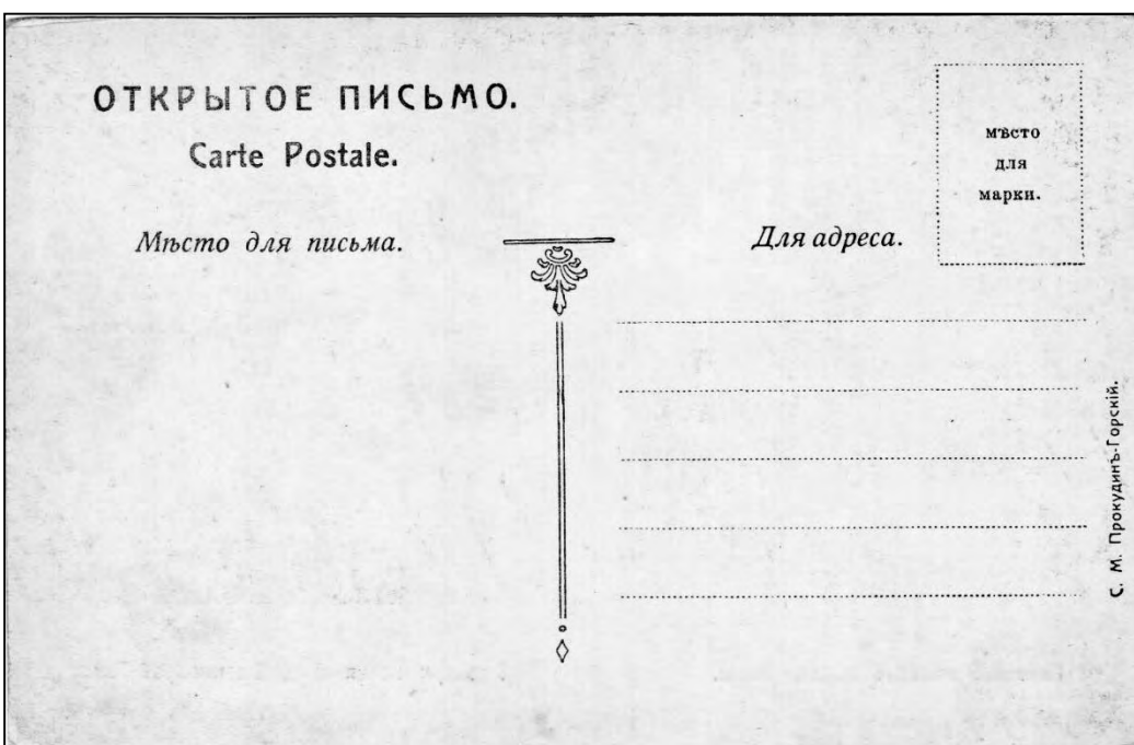
Электрическая ж. д. Бахчисарай – Ялта: главный вокзал города Ялты / фот. С. М. Прокудин-Горский. [Б. м.], [после 1904].