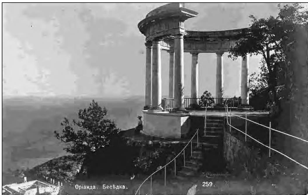
Ореанда: бесѣдка: открытое письмо / фот. В. Н. Сокольников. [Б. м.], [после 1904]. [фотооткрытка]. [сер. «Виды Крыма»].

На этом этапе работы источниковедческий анализ видовых открыток существенно отличается от схем, принятых для изобразительных документов, которые стали результатом творческого поиска: живописи, графики, гравюр, акварели, художественной фотографии, авторы которых изображали не окружающий мир, а лишь свое видение его. Исследование всех вопросов, связанных с авторством, имеет большое значение. Получение сведений об авторе, биографии фотографа, основных этапах его деятельности помогает не только в определении обстоятельств создания источника, но и при определении ценности источника [15; с. 111].