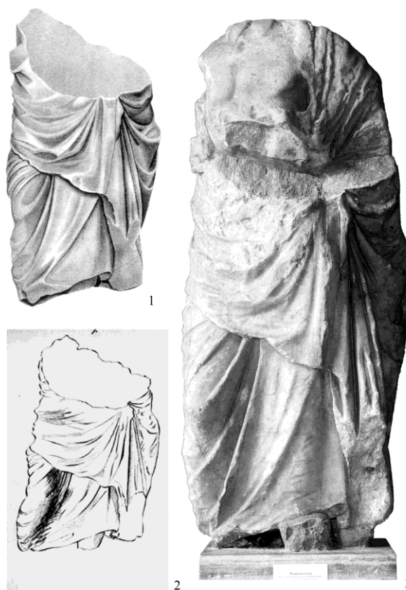
Рис. 2. 1. – «Колоссальный торс Эскулапа» (Ашик, 1848, III, р. СI); 2. – Торс «колоссальной мраморной статуи Эскулапа». Рис. А. Я. Фабра (Дюбрюкс, 2010, рис. 94). 3. – Статуя боспорского царя Перисада (современное состояние, Эрмитаж).

Четыре барельефа, из которых два «высокой работы, с именами усопших и окончанием – радуйся», насчитал на стенах храма в 1825 г. П. П. Свиньин [27, с. 458]. При этом, как и Р. Лайелла, его внимание особенно привлекли «женская колоссальная статуя отменно смелого резца» и «торс мужчины... гораздо низшей работы», установленные в церковном дворе [27, с. 458–459]. «Великое множество надписей, барельефов, обломков от колонн, вмазанных в стены церкви и находимых вокруг ея» позволили ему предположить, что она была построена первыми «пришедшими сюда христианами из развалин храма знаменитого Эскулапа Пантикапейского» [28, с. 24; 29, с. 366].