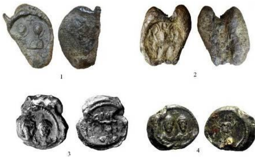
Рис. 2. Ранневизантийские свинцовые пломбы из Херсонесе и его округи