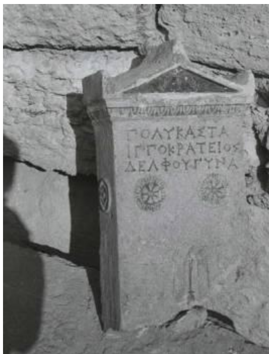
Рис. 5. Башня XVII. Фрагменты архитектурных деталей и надгробных памятников, обнаруженных внутри башни. Съемка А. М. Михайловой и С. Ф. Стржелецкого. НА ГМЗ ХТ. Ф. 3. НА ГМЗ ХТ. Нег. 13857/8.