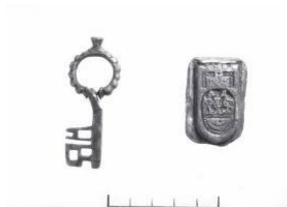
Рис. 9. Ключ бронзовый на кольце и бронзовая печать (?) с геральдическим изображением птиц по сторонам креста. НА ГМЗ ХТ. Негатив № 13077.