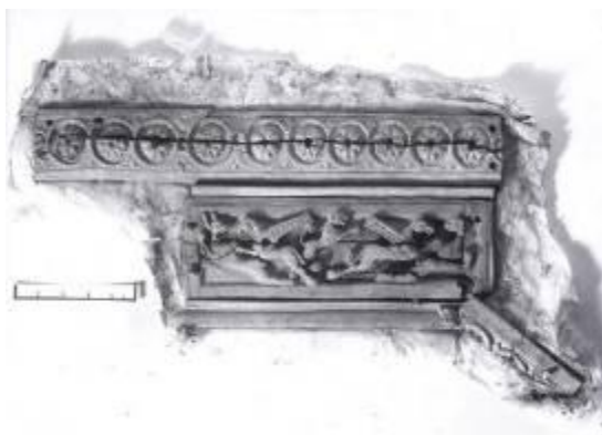
Рис. 8. Накладные резные пластинки слоновой кости от шкатулки X–XI вв. из слоя в третьей подошве 15-й улицы у входа в пом. 36в. После первоначальной консервации (реставрационные работы проводила А. А. Ионова). НА ГМЗ ХТ. Нег. 12292/2.