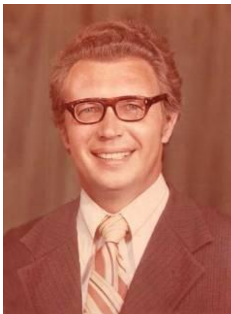
Рис. 1: В. Н. Даниленко (1936–2007). Фото 1976 г.