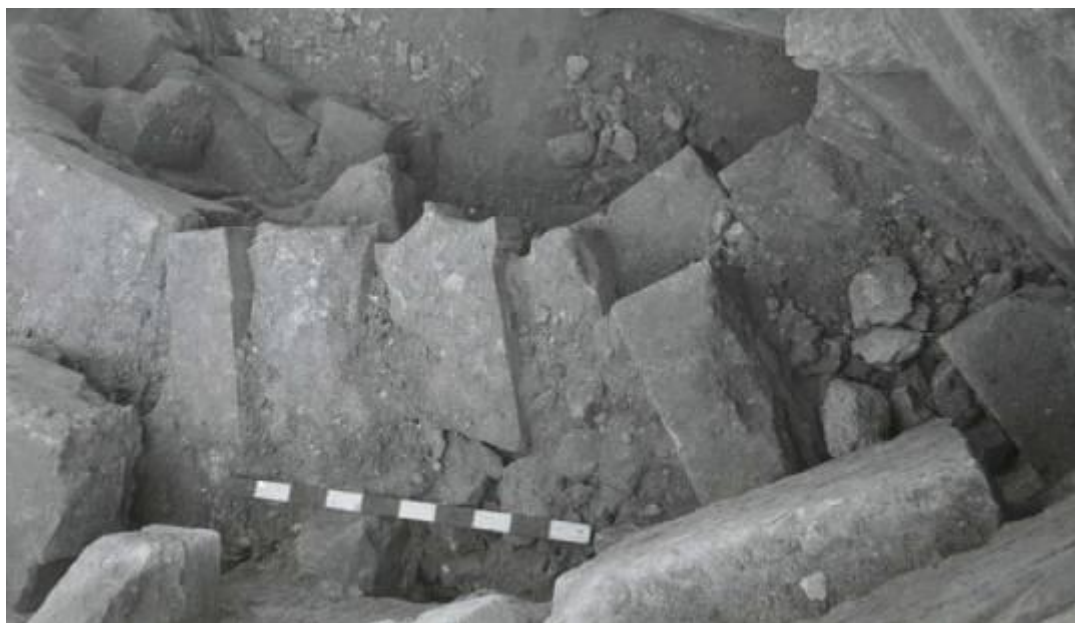
Рис. 4. Башня XVII. Фрагменты архитектурных деталей и надгробных памятников, обнаруженных внутри башни. Съемка А. М. Михайловой и С. Ф. Стржелецкого. НА ГМЗ ХТ. Ф. 3. Нег. 13857/20.