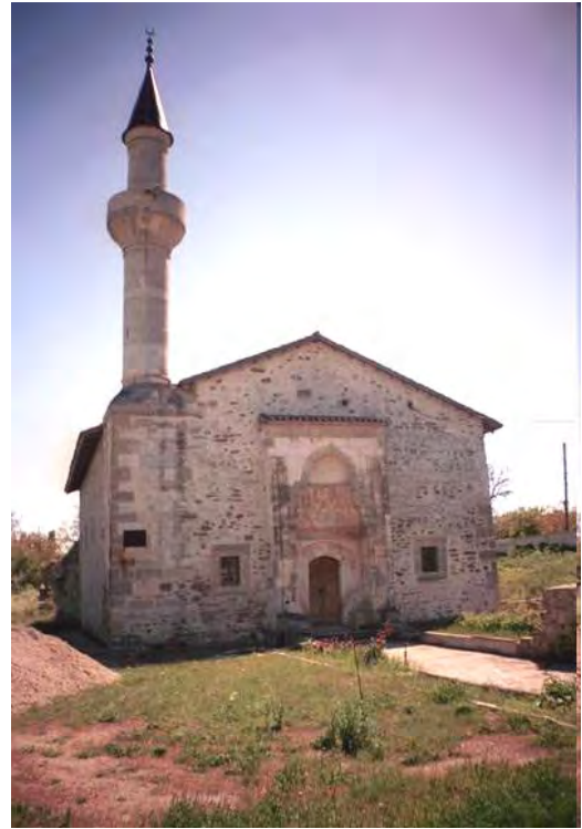
Современный вид фасада мечети Узбека