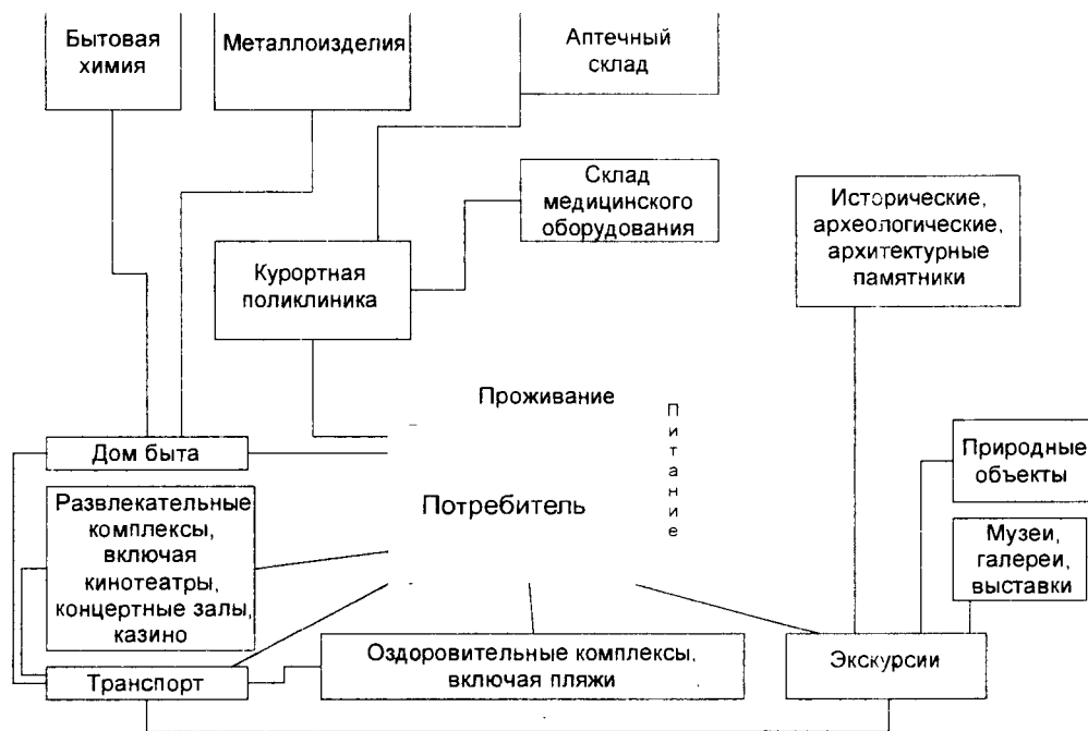
Рис. 1. Схематическое изображение рекреационной услуги в виде логистического куста.

Логистизация дает основание для более тесной связи снабжения и производства, что положительно влияет на конечные показатели деятельности предприятия (рис. 2).