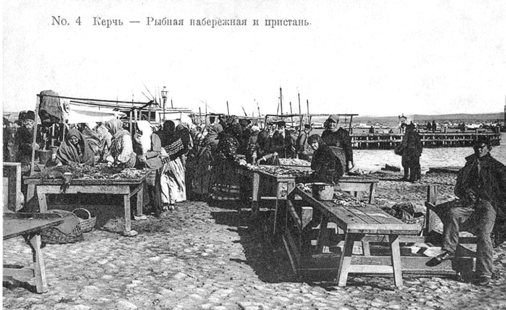
Керчь. Рыбная набережная и пристань. Фото начала ХХ в.

мати дозвіл від управи на виробництво даного промислу [32]. Лахмітникам було заборонено входити в будинки без дозволу власників, продавати ношений товар вони мали право виключно на товкучці.