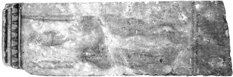
Рис. 3. Стела врача, Херсонес