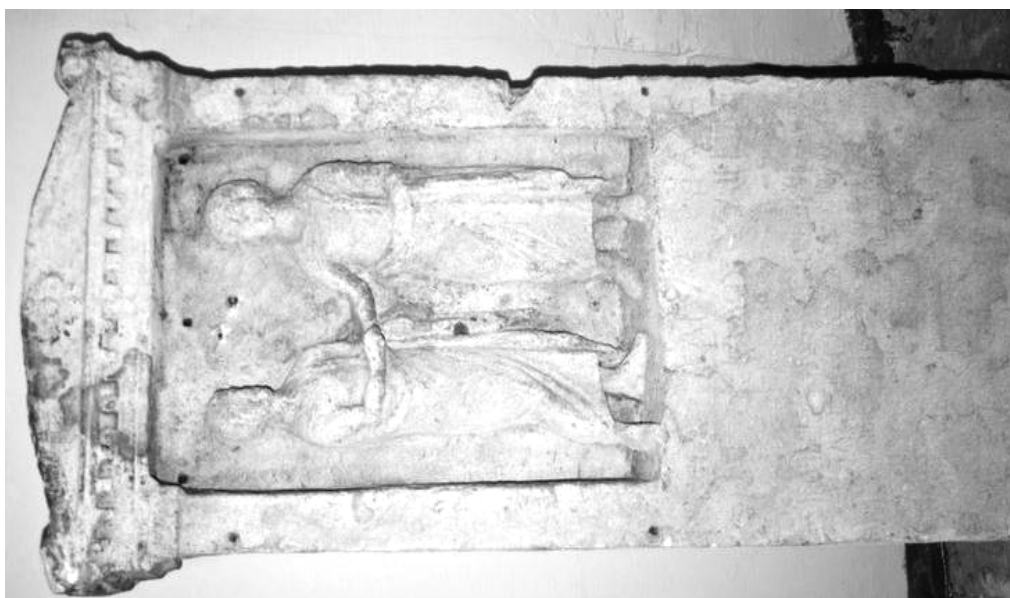
Рис. 1. Сцена прощания на стеле