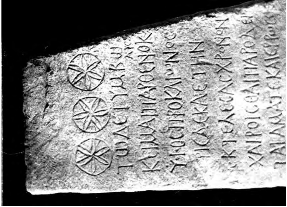
Рис. 4. Стела Парфенокла, Херсонес.