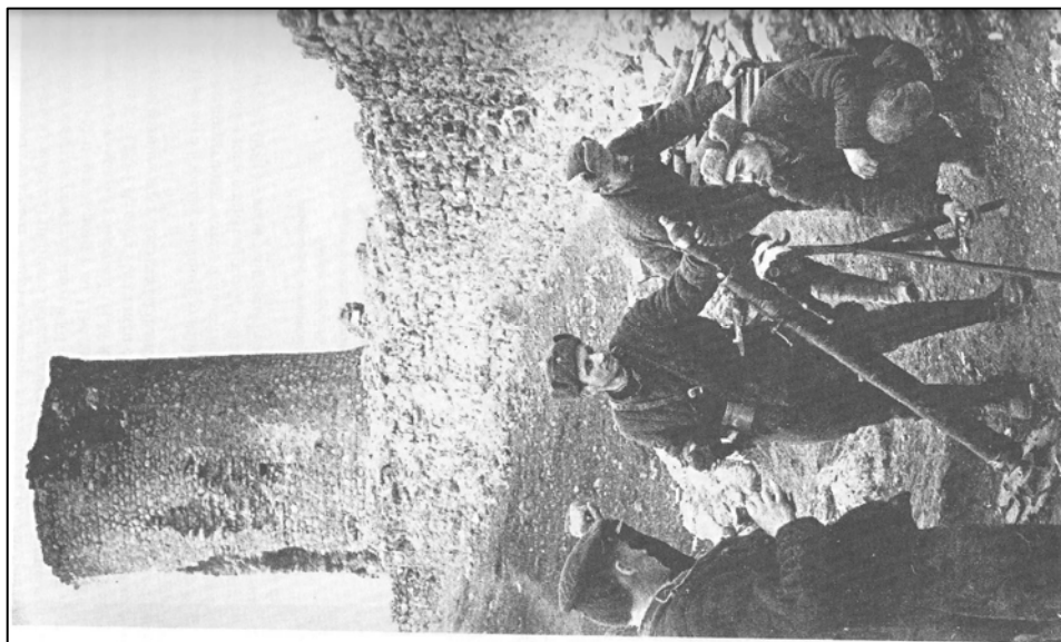
Рис. 4. Боевая позиция советских войск на крепости Чембало