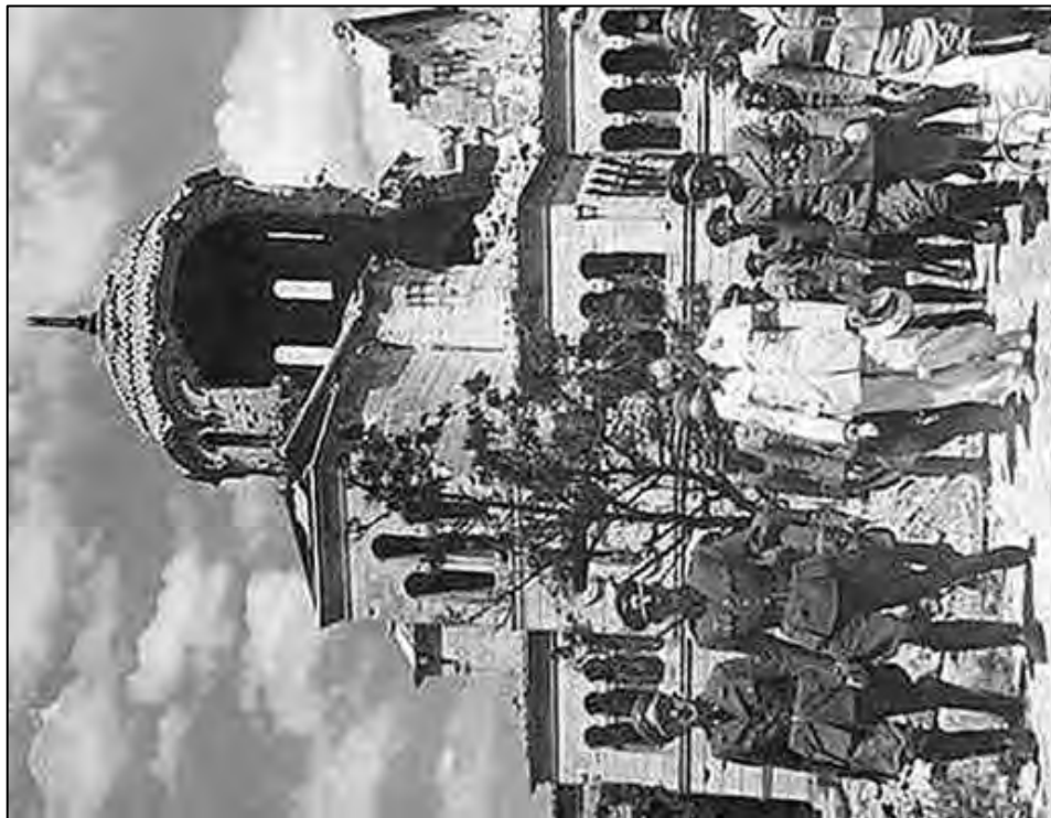
Рис. 3. Владимирский собор. Визит рейхслайтера нацистской Германии А.Розенберга