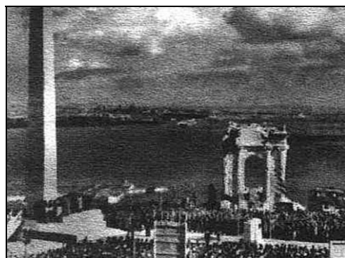
Рис. 2. Мавзолей Стемпковского на г. Митридат в г. Керчи. Осень 1944. Открытие Обелиска на г. Митридат