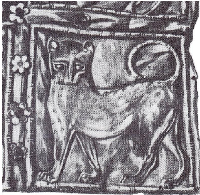
Рис. 2. Инталя. Канал для стержня дужки.

Сам способ обработки камня с применением бутероли (круглого сверла), рельефной окантовки и полировки камня указывают на классическое время изготовления инталей, скорее всего – на IV в. до н.э. Вращающиеся скарабеиды в III в. до н.э. уже не применялись [8, с. 30–31; 10, с. 110; 11, с. 21]. Такие приемы, равно как изображения зверей, чаще всего использовались резчиками Восточной Греции и Ионии. В греческих городах этих областей искусство резьбы по камню и его продукция пользовались особой популярностью [11, с. 21–22, 95]. Этот регион был теснейшим образом связан с Боспором со времени Великой греческой колонизации. Оттуда в боспорские города пришла традиция ношения инталей с образами животных и хищников. Как правило, фигуры зверей прекрасно построены ионийскими мастерами-резчиками и с большим мастерством вписаны в эллипс скарабеоида [3, с. 441, 444]. Ведь на территории Боспорского царства, особенно в некрополях, таких инталей найдено несколько десятков, гораздо больше, чем в других городах Северного Причерноморья. В подражание им массово изготавливались и дешевые их варианты из стекла – литики, получившие большое распространение на Боспоре с I в. до н.э. Их находят и в рядовых гробницах [10, с. 108–109].