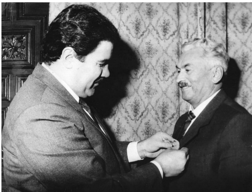
Прием президентом Республики Афганистан группы советских советников в связи с их отъездом на родину. М. Наджибулла и М. Ф. Слинкин. Дворец «Гольхана». Июль 1988 г.

Ряд выдвигаемых автором положений вступают в противоречие со сложившимся в нашей литературе по этой стране оценкам многочисленных высокопоставленных советских военных представителей и дипломатических работников. В частности, такими из них являются утверждения о том, что якобы среди афганского руководства было широко распространено иждивенчество и более того пьянство.