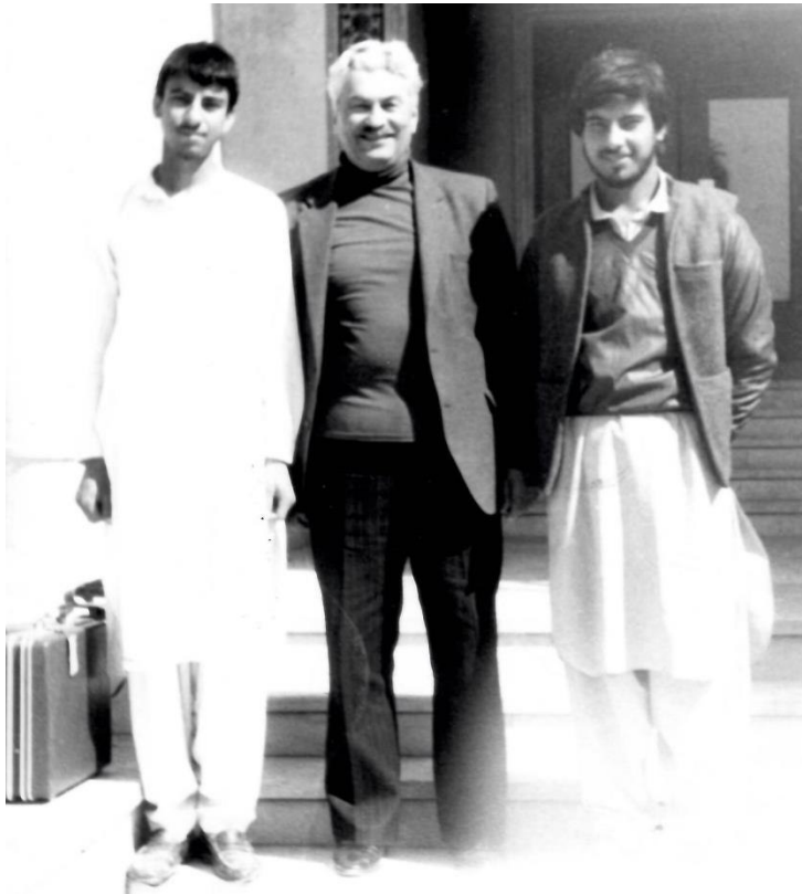
Бывший королевский дворец в Джалалабаде. С местными лицеистами. 4 апреля 1988 г.

моджахеды», «Таможня дает «добро», «Танкисты, артиллеристы и другие»), помимо бытовых зарисовок, отличающихся внимательным и заинтересованным взглядом исследователя на жизнь Афганистана, посвящено работе в армейской среде, трудному процессу становления современных вооруженных сил страны, подготовке их командных кадров и рядового состава к обслуживанию, эксплуатации и применению поставляемых из Советского Союза техники и вооружения. Автор пишет о глубокой модернизации армии Афганистана, насущной необходимости реорганизации ее организационно-штатной структуры в 1960-е гг. в связи с существовавшими тогда угрозами ее безопасности, адаптации афганцев к сложным и требующим специальных навыков в их применении новым для них видам вооружения.