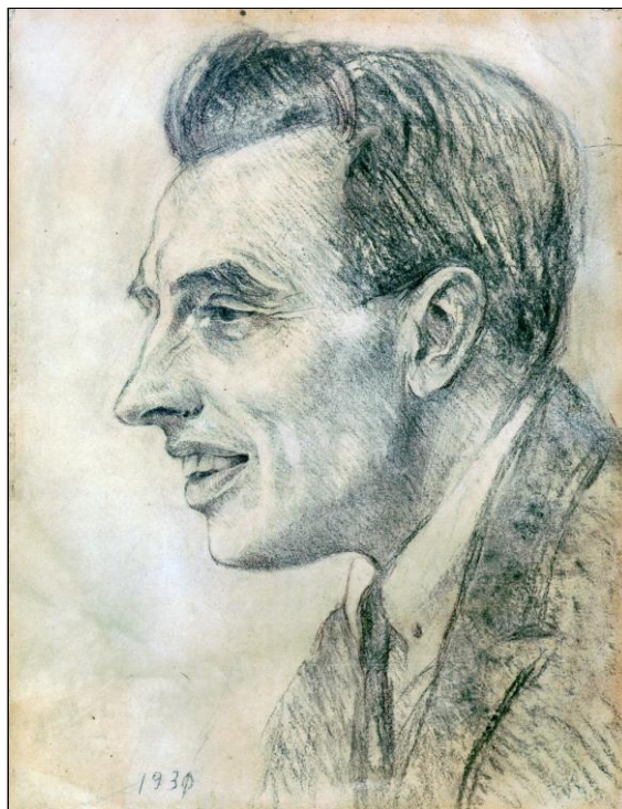
Портрет Глеба. Карандаш. 1930 г. Работа Ольги Георгиевны Бонч-Осмоловской.

Автор ее П. А. Куликовский 1 – личность достаточно известная. В молодости он являлся членом боевой организации эсеров. После февраля 1917 г. мечтал о