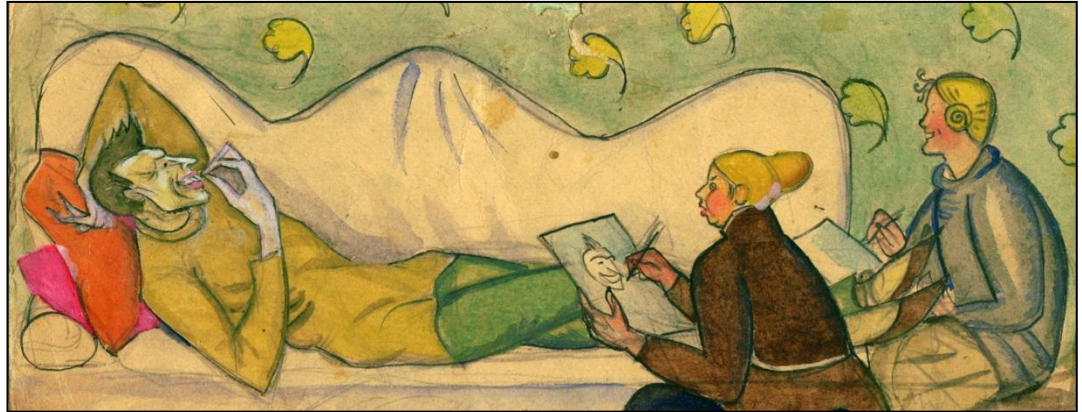
Бонч ведет дискуссию... Карикатура Елены Георгиевны Морозовой. 1918 – нач. 1919 г.

Помню нашу последнюю встречу. Это были годы войны в Европе, еще не перенесенной на родные поля. После вялых боев на Западном фронте наступил furor teutonicus . Франция была накануне поражения. Глеб верил уже тогда, что в ней пробудятся силы сопротивления. Он умер уже в те месяцы, когда силы гитлеровских полчищ были надломлены на полях его родной земли. Но ему не удалось дожить до торжества победы, не довелось ему довести до конца свои труды над таврическим палеолитом.