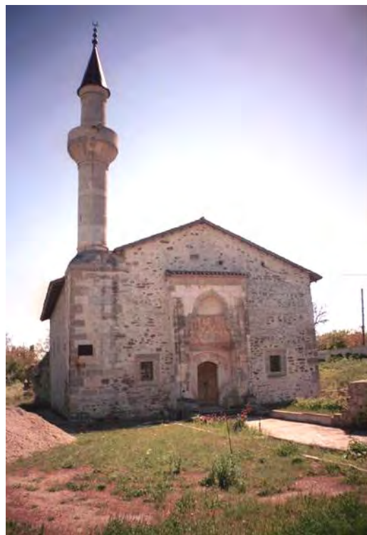
Современный вид фасада мечети Узбека