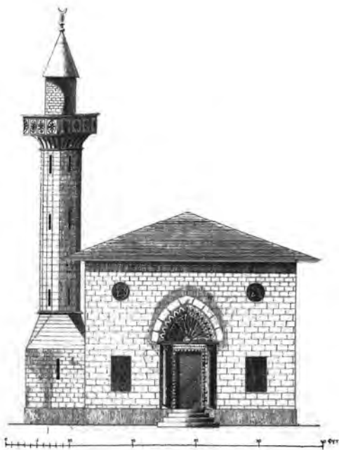
План фасада мечети Узбека в Старом Крыму (ЗООИД.– 1883.– Т. 13.– С. 297)