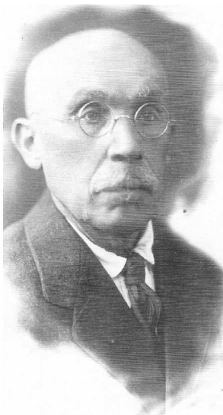
Сергей Александрович Жебелёв

кими слоями населения» [9]. В состав этого органа входили представители Археографической комиссии, Эрмитажа, Московского публичного и Румянцевского музея, всех вузов Петрограда, Русского библиологического общества, Союза российских архивных деятелей, Русского археологического общества, Русского географического общества, вольного экономического общества, Русского технического общества, Всероссийского учительского союза, союза лекторов педагогических курсов, 10 представителей от студенческих организаций вузов Петрограда, Петроградского Совета рабочих и солдатских депутатов и ряд представителей от других культурно-просветительских организаций по указанию Наркомпроса, 10 представителей от читателей. Таким образом, Совет – орган громоздкий и, как следствие, малопродуктивный – насчитывал более ста человек и занимался решением принципиальных вопросов научной и административно-хозяйственной деятельности Библиотеки.