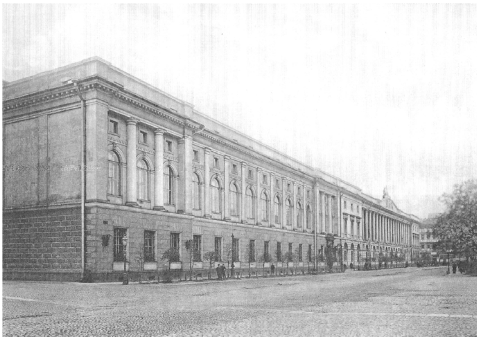
Российская Публичная библиотека