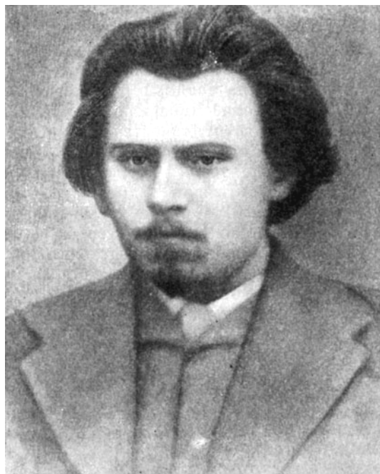
Фото 4. Желябов А. И. 70-е годы XIX века.