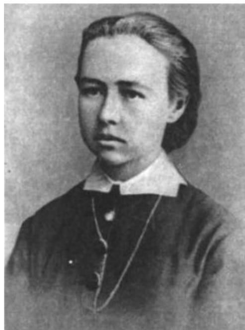
Фото 5. Перовская С. Л. 70-е годы XIX века