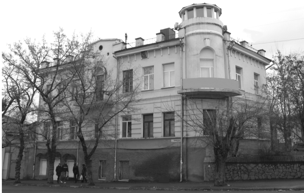
Фото 2. Здание бывшего Таврического губернского жандармского управления в Симферополе. 2010 г.