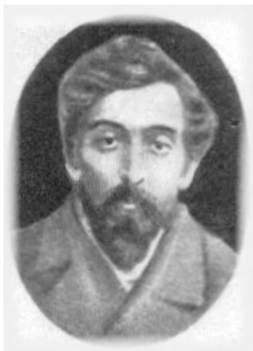
Фото 6. Телалов П. А. 70-е годы XIX века