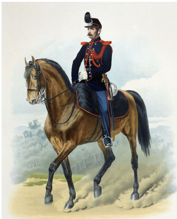
Рис. 1. Нижний чин Корпуса жандармов (в парадной форме). 60-е – 70-е годы XIX века.

В ходе реформирования органов имперской государственной безопасности произошли изменения и в способах их комплектования. С 1870-х годов все офицеры, желавшие перейти на службу в Корпус жандармов, испытывались при Штабе Корпуса, как в нравственных качествах, так и в служебных достоинствах. Все кандидаты должны были ранее прослужить не менее 5 лет в армии и окончить курс наук не ниже средних учебных заведений [3]. Следует отметить, что большинство офицеров политической полиции, назначавшихся на должности в Таврическое ГЖУ, уже имели к этому времени определенный стаж службы. Например, подполковник Самойлов до перевода на службу в Крым в 1873 году был начальником Вилькомирского и Ковенского уездного жандармского управления, а полковник Бельский (начальник Таврического ГЖУ с 1878 года) – начальником Волынского жандармского управления [9, л. 1; 10, л. 14]. Благодаря высокому профессиональному уровню жандармских офицеров, их, при отсутствии подходящих кандидатур,