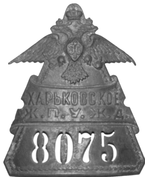
Фото 3. Нагрудный должностной знак сотрудника Харьковского жандармского полицейского управления железных дорог.