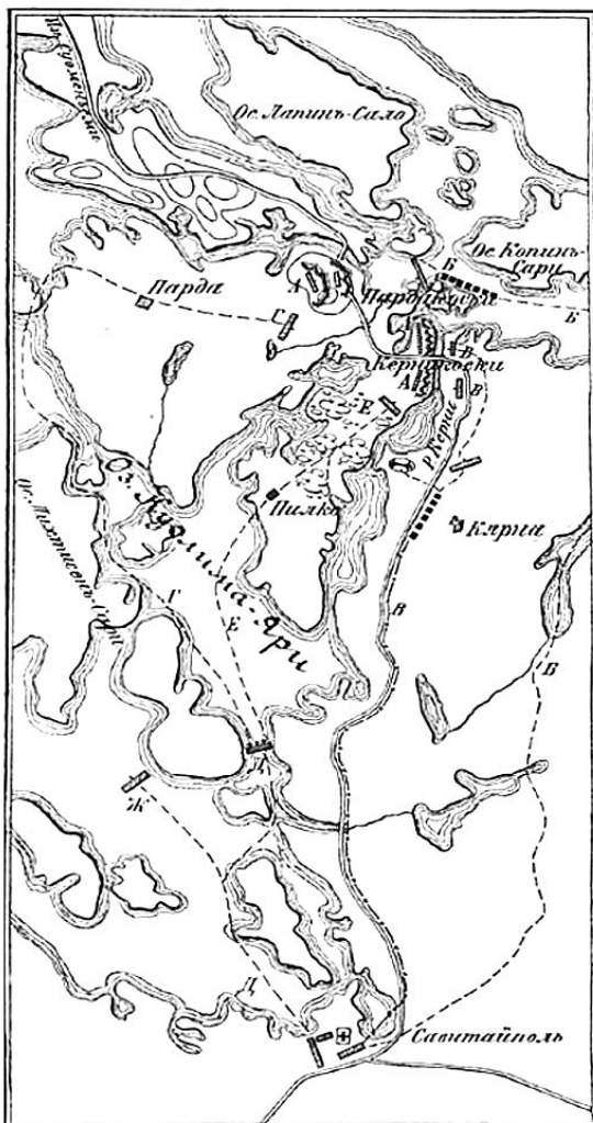
Планъ Сраженія при Пардакоскахъ 18 Апр. 1790 г.

А - Шведскія войска. Г - Колонна кн. Мещерскаго. Б - колонна Байкова. Д - Колонна Берхмана. В - Колонна Сухтелена. Е - Отрядъ Ершова. Ж - Отрядъ бар. Френсдорфа.