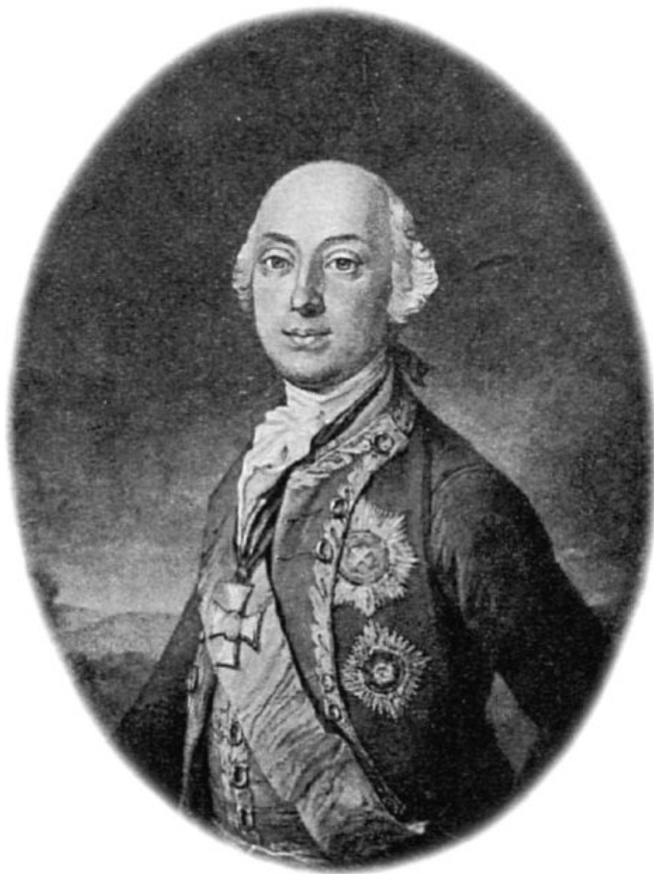
Віктор Амадей принц Ангальт-Бернбург-Шаумбург-Хойм (21 травня 1744 - 2 травня 1790) з гравюри і. Піклера портрета пензля В. Тішбейна