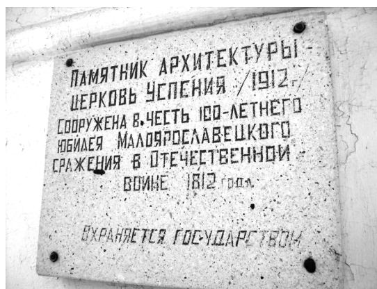
Памятная доска на храме Успения Пресвятой Богородицы