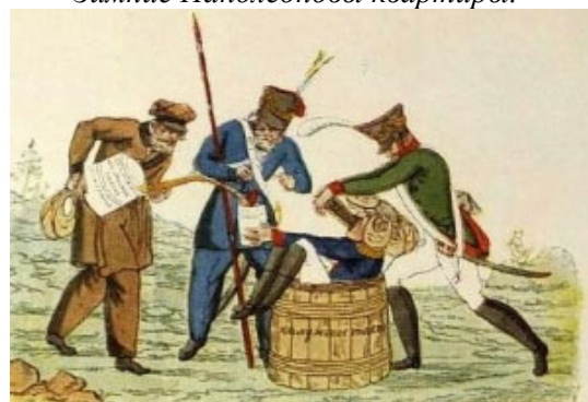
Селиванов С. Угощение Наполеона в России