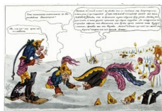
Венецианов А.Г. Зимние Наполеоновы квартиры.