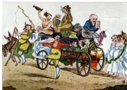
Венецианов А.Г. Изгнание из Москвы французских актрис.