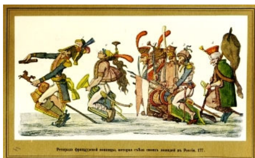
Теребенев И.И. Ретирада французской конницы, которая съела своих лошадей в России.