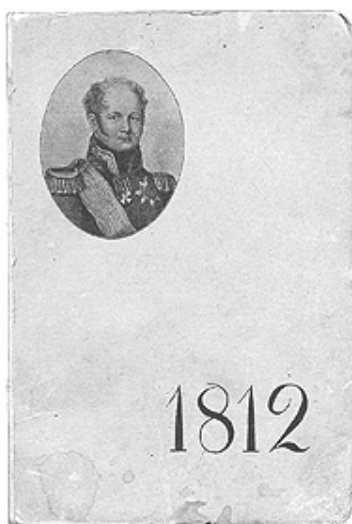
Обложка брошюры А. Я. Ефименко