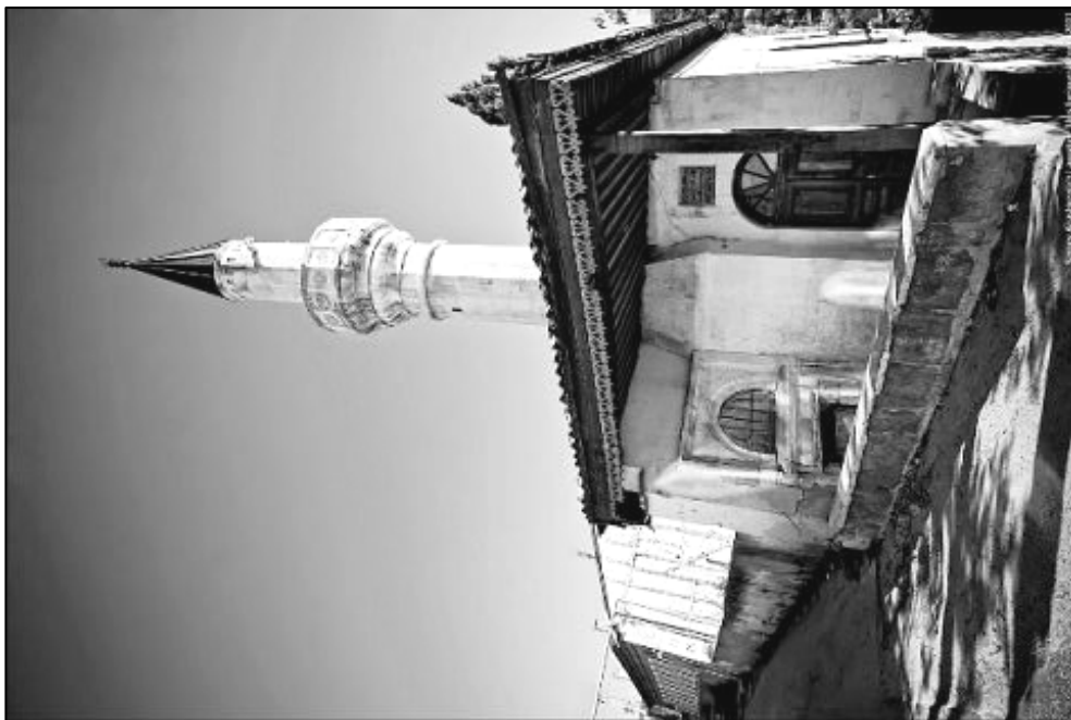
Рис. 6. Мечеть Тахталы-Джами. Современный вид