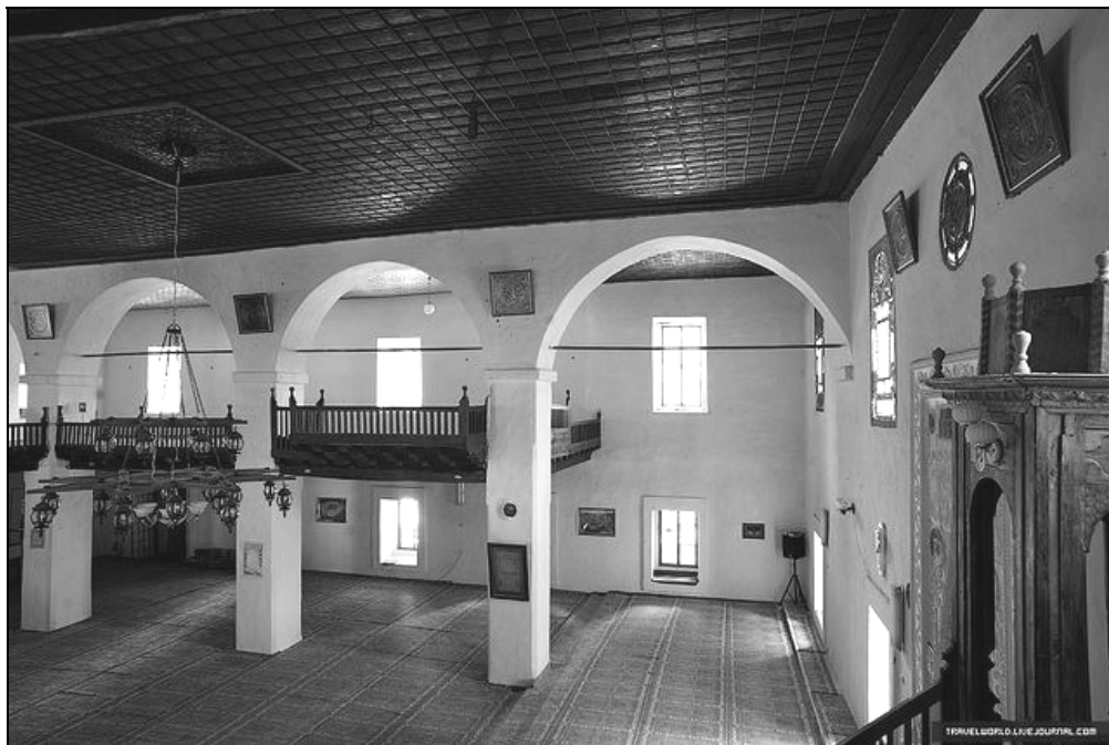
Рис. 3. Внутренний вид Ханской мечети. Фото 2014 г.