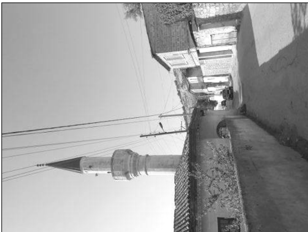
Рис.5. Мечеть Тахталы-Джами (вид с северо-востока).