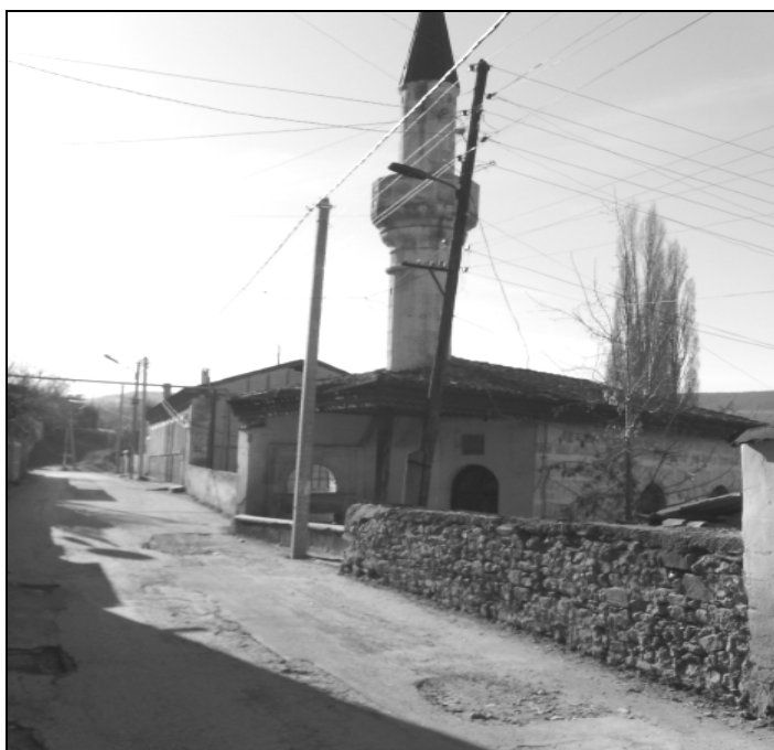
Рис. 4. Мечеть Тахталы-Джами. Вид с улицы. Навес, опирающийся на колонну. Фото 2014 г.