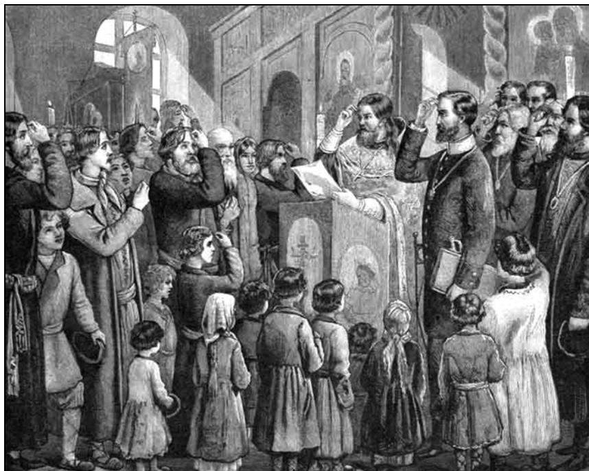
Рис. 3. Чтение в церкви Манифеста об отмене крепостного права (1861 г.)