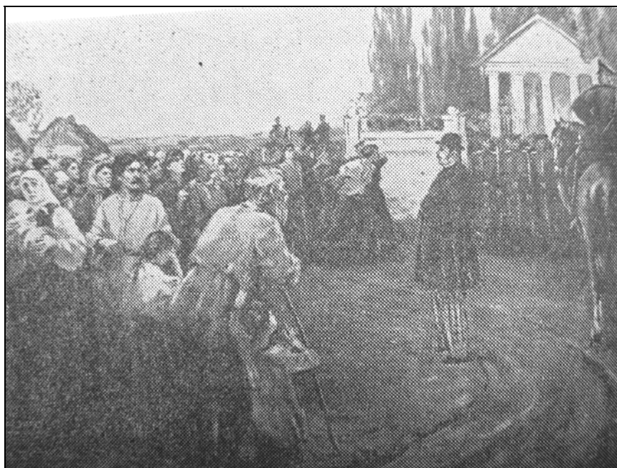
Рис. 4. Картина В. Д. Вернадского «Волнение крестьян села Обиточного после реформы 1861 г.»