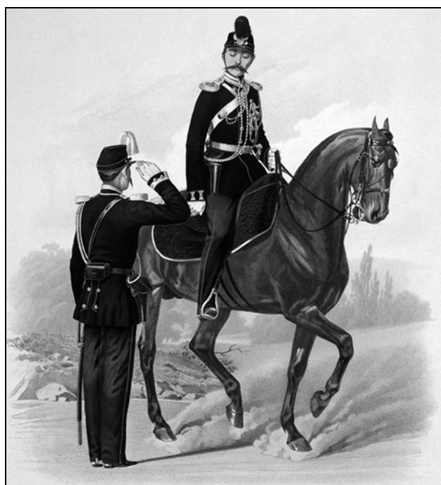
Рис. 2. Унтер-офицер и обер-офицер Корпуса жандармов в парадной форме (1862 г.)