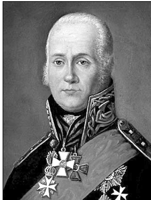
Федор Федорович Ушаков