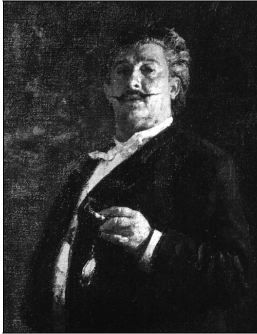
Михаил Осипович Микешин