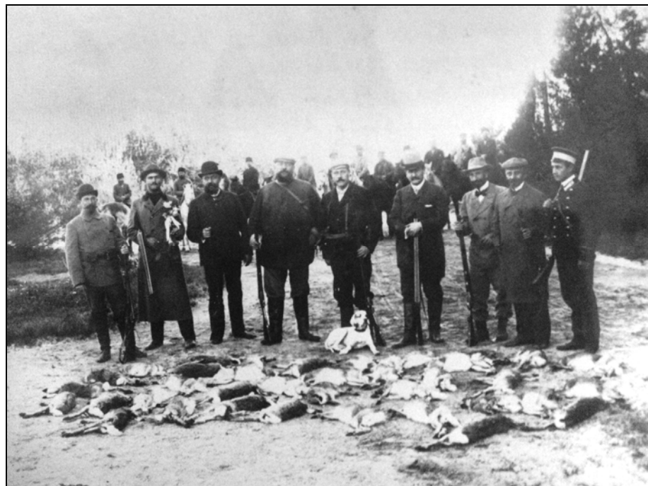
Члены Днепровского отдела после удачной охоты