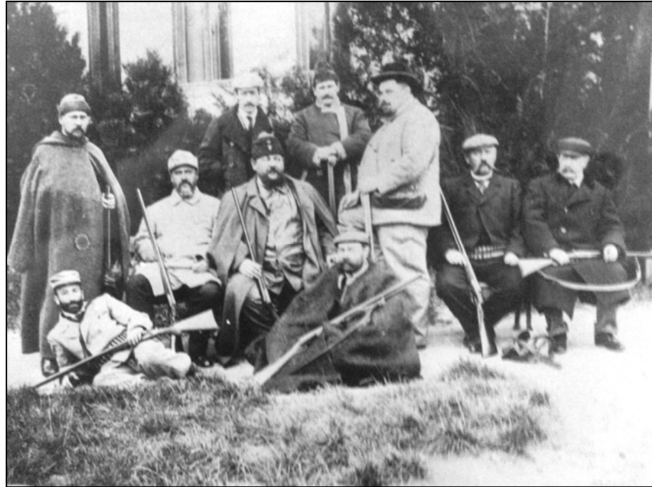
Члены Днепровского отдела перед охотой