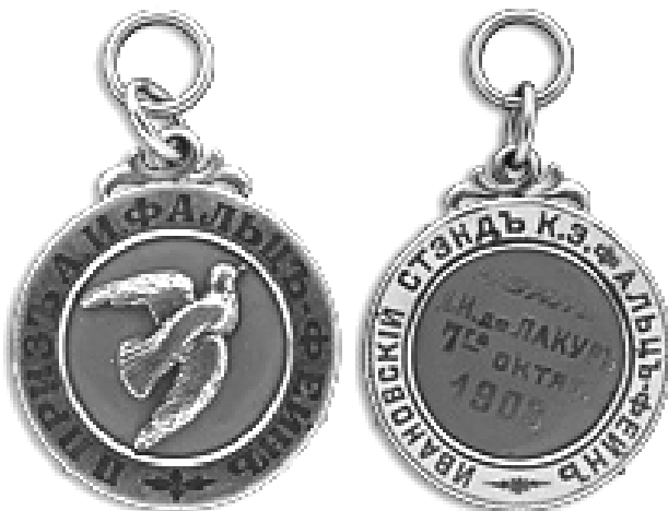
Призовой жетон охотничьих испытаний, 1903 год