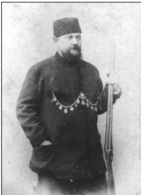
Александр Иванович Фальц-Фейн