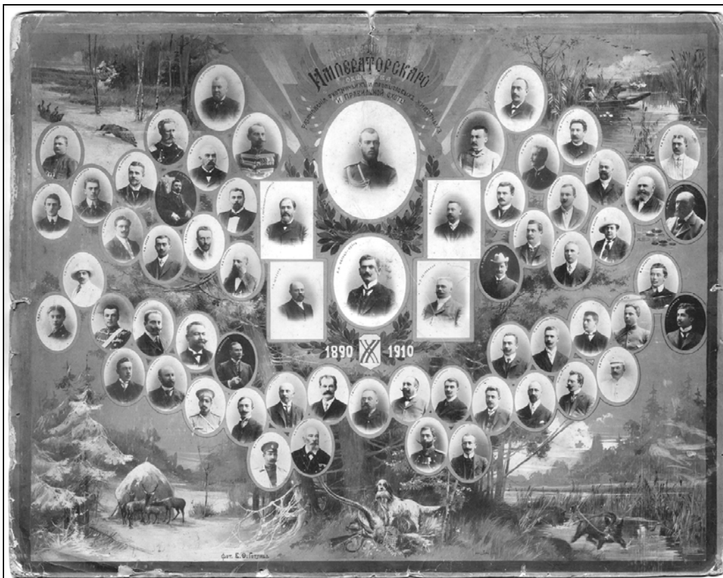
Памятная виньетка членов Днепровского отдела, сделанная в честь 20-летия Общества