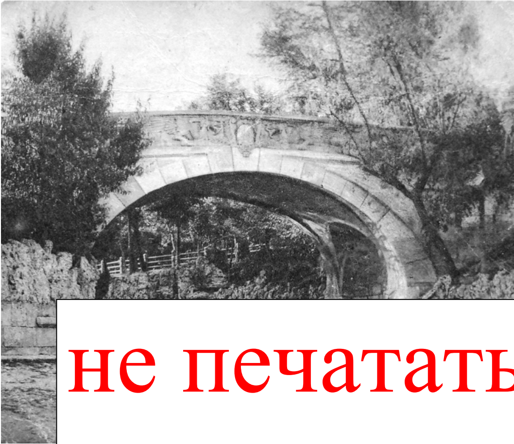
Фото. 5. Севастополь. Вид на Приморський бульвар (20-ті роки XX століття)

У свою чергу підвідділ живопису першої чверті XIX століття «академічного» напрямлення містив роботи Т. А. Неффа та М. Н. Воробйова, які відображали «смаки аристократії олександрійського та миколаївського часів». Підвідділ живопису другої чверті XIX століття був складений із витворів Карла-Фрідріха Петровича Бодрі («Пряха»), Миколи Адріановича Протопопова («Селянський двір») та серії картин Леоніда Івановича Соломаткіна. Всі ці роботи, за висловлюванням М. П. Крошицького, відображали селянський типаж та побут у формі дотепної сатири, при цьому малюють інтереси та устрій дворянсько-поміщицького середовища. Також було відкрито відділ акварельного живопису у підвалини якого покладено роботи М. О. Зичі, П. Ф. Соколова, О. Є. Єгорова та ін. [18, с. 4].